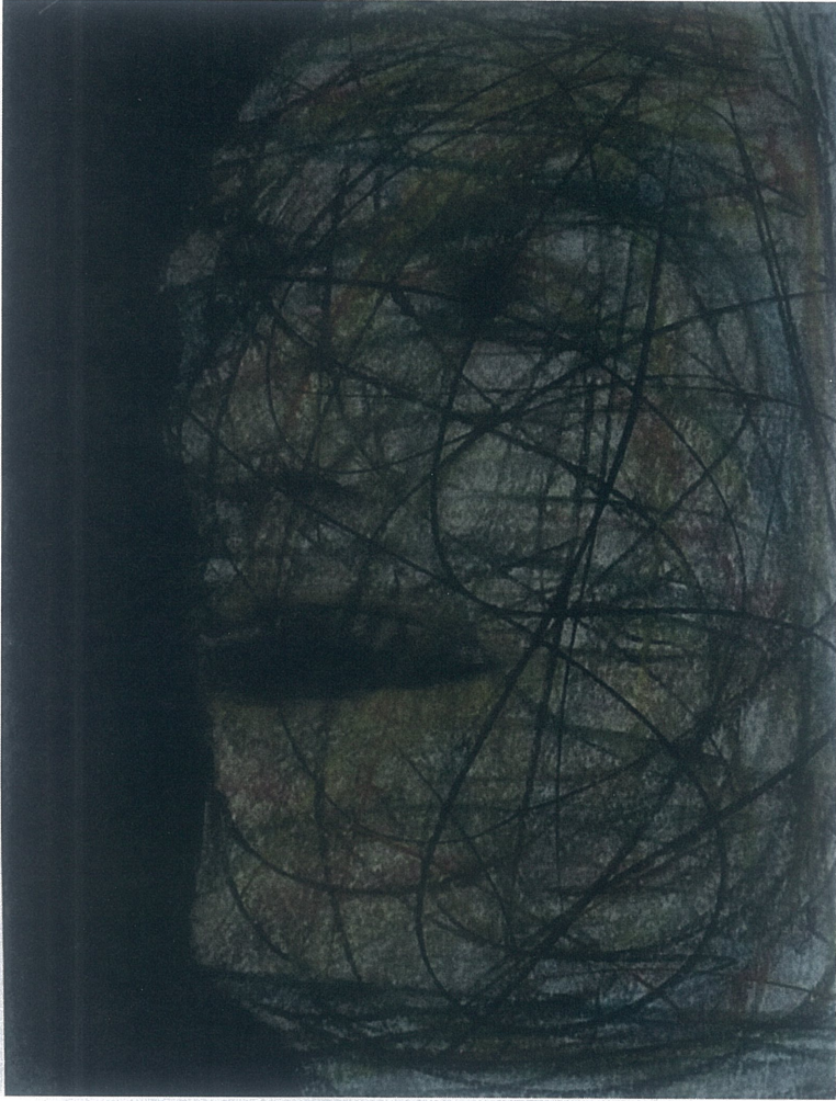
Resim 2.9. Orhan Sönmez 'Modern Prometheus', 2021, 35x50, Resim Kağıdı Üzerine Toz Pastel Boya

Arka planın yer yer beyaz olsa da çoğunluklu mavi renk olması, insanın kaybolmuşluğunun aslında yeni bir kendini keşif olduğunu anlayabiliriz. İnsan, önce kendinde kaybolur, sonra toplumda ve en sonunda kendi ruhunda yeniden ve daha sağlam şekilde var olur. Bu çalışma bize bunu hatırlatmaktadır.