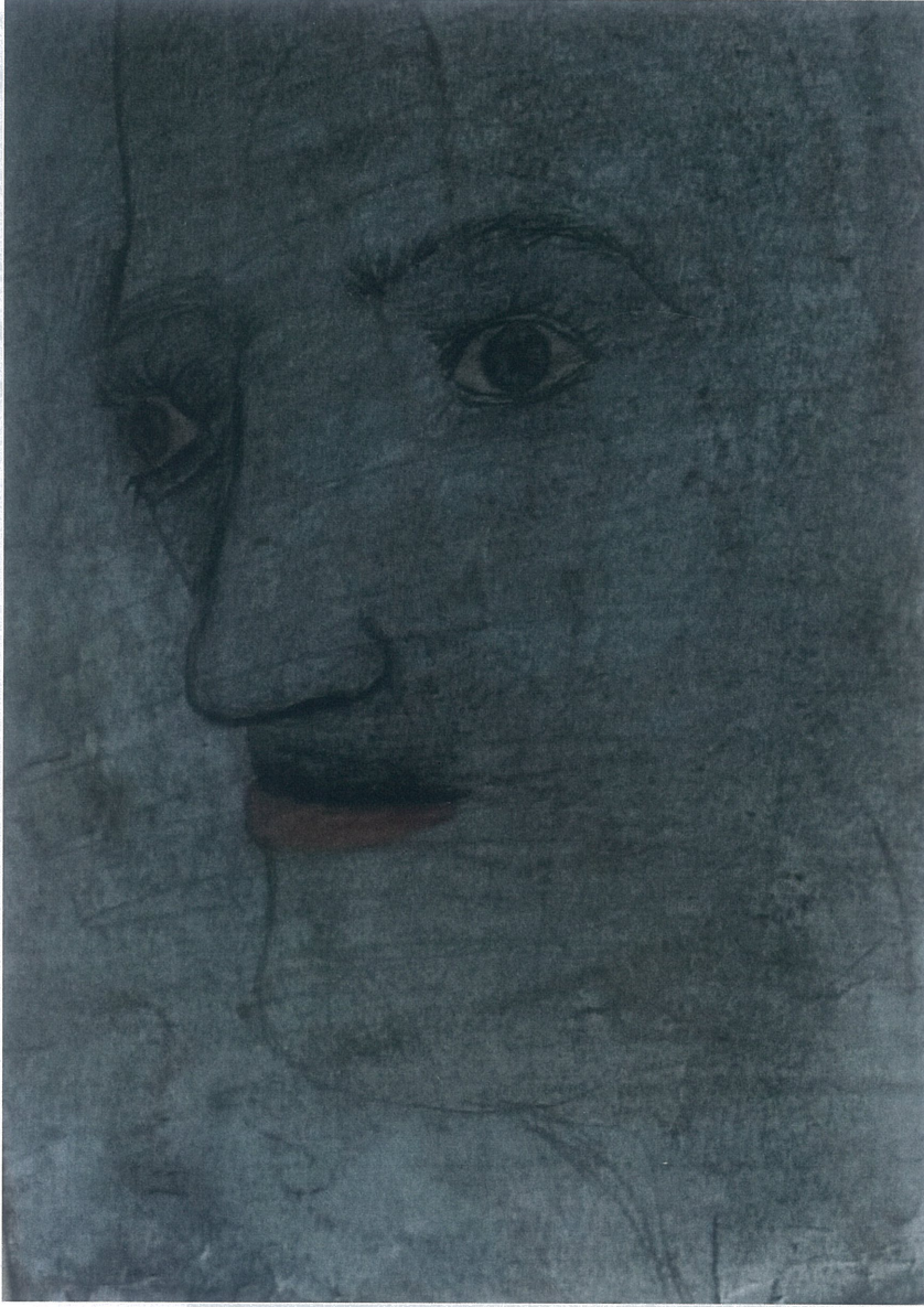
Resim 2.2. Orhan Sönmez 'Öğretmen', 2021, 20x30, Resim Kağıdı Üzerine Toz-Yağlı Pastel Boya

Orhan Sönmez'in 'Öğretmen' adlı çalışmasında, yüz aracılığıyla, sığ ve derinliksiz anlayışlarla çevrili dünyada, onu anlamaya çalışıp çevresiyle uyumunu zorlaştıran insan çaresizliğinin en yalın hali anlatılmaktadır. Burada hiçbir şey bilmediğini bilenle, her şeyi bildiğini bilmeyen insanın, kendi içinde yaşadığı çelişkiyle oluşan bir paradoks