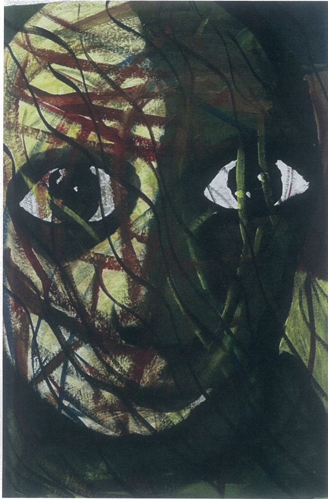
Resim 2.5. Orhan Sönmez 'Yoksulluk', 2023, 35x50, Resim Kağıdı Üzerine Akrilik Boya

Eserin duygu dünyasının ve yüz ifadesinin karmaşıklığı, renklerin karmaşası ve kalabalıklığı ile doğru orantılı. Aynı zamanda ilk bölümde değindiğimiz gibi çatık kaş ve dudaklardaki hareketsizlik sinir ve öfkeye işaret eder. Fizyonomi açısından ruh dünyasında huzursuz bir birey olduğu sonucuna varılabilir.