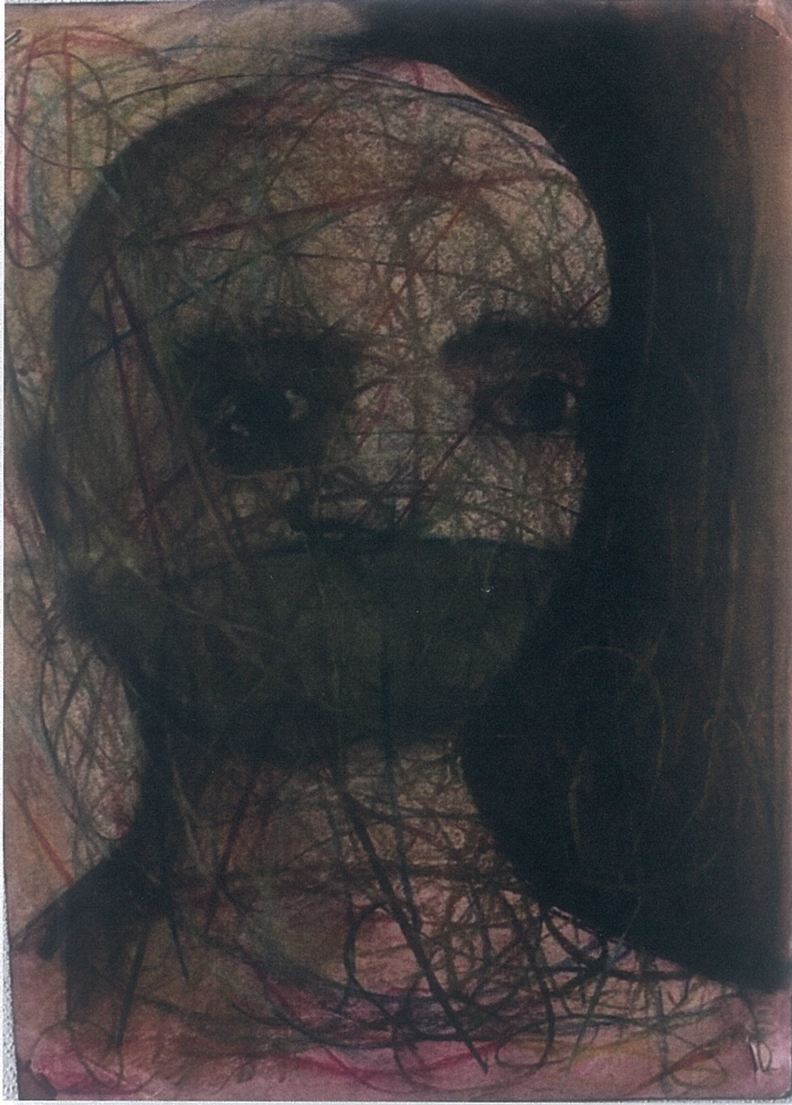
Resim 2.7. Orhan Sönmez 'Kadının Sessiz Çığlığı', 2021, 20x30, Resim Kağıdı Üzerine Toz-Yağlı Pastel Boya

Korku esnasında göz bebekleri büyür, kaşlar standart halinden uzaklaşır ve ağız açılabilirdiği kadar açılır. Burun delikleri aynı oranda büyür ve genişler. Portre, bize bütün bunların olduğu bir duyguyu sunmaktadır.