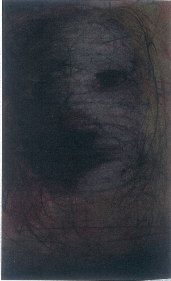
Resim 2.10. Orhan Sönmez ‘Medusa’, 2021, 35x50, Resim Kağıdı Üzerine Toz Pastel Boya

Ne yapacağını bilemeyen, bir şaşkınlık hali üzerinde ve bu durumda bile kayıtsızlığını bozmayan bir yüz ifadesi. Büyük burun, sivri çene onda bir karakteristik duygu oluştursa da soğuk ve mesafeli olduğu gerçeğini değiştirmiyor. Zeminin karanlık tonda oluşu, umutsuzluk ve çaresizliğin resimde baskın karakterde olduğunu adeta ifade etmekte.