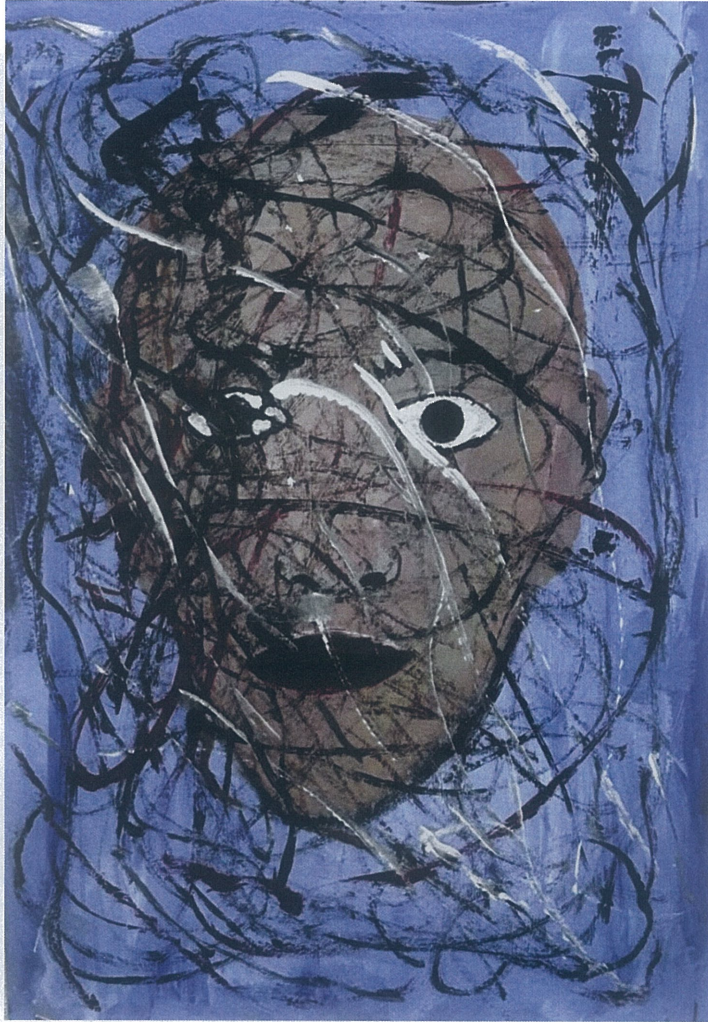
Resim 2.8. Orhan Sönmez 'Anlam Arayışı', 2023, 35x50, Resim Kağıdı Üzerine Akrilik Boya

Kadının saçı yoktur. Bu durumda saçlarını hastalık vs. gibi sebeplerle kaybettiğini düşünebiliriz. Buna bağlı olarak çektiği acı ve umutsuzluk mavi göz bebeklerine yansımıştır. Yüzünün görünen her kısmında ruhunda beslediği acı gözlemlenmektedir.