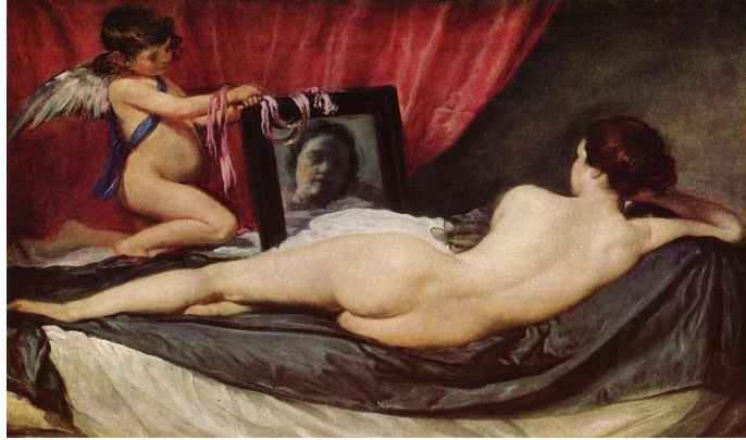
Resim1.1. Velazquez, Venus at Her Mirror, 1647-1651

Yansıtma kuramı izleyicinin sanat eseriyle etkileşime geçerek kendi yaşam deneyimlerini yansıtabileceğini ve sanat eserinden yansıyan duygular düşünceler veya anlamlar aracılığıyla bir anlam inşa edebileceğini savunur. Bu kurama göre, sanat eseri izleyiciye kendi iç dünyasında bir yolculuk yapma fırsatı sunar ve onun kendini ifade etmesine ve anlamlandırmasına yardımcı olur.