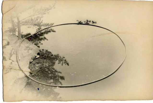
Resim1.3. Yamamoto Masao, form Nakazora,2002

Doğa ve sanat arasında derin ve karmaşık bir ilişki bulunmaktadır. Doğa, sanatın ilham kaynağı, tema ve içeriği olabilirken, sanat da doğanın güzelliklerini yansıtabilir, doğayı yorumlayabilir ve doğayla olan insan bağına ifade edebilir.