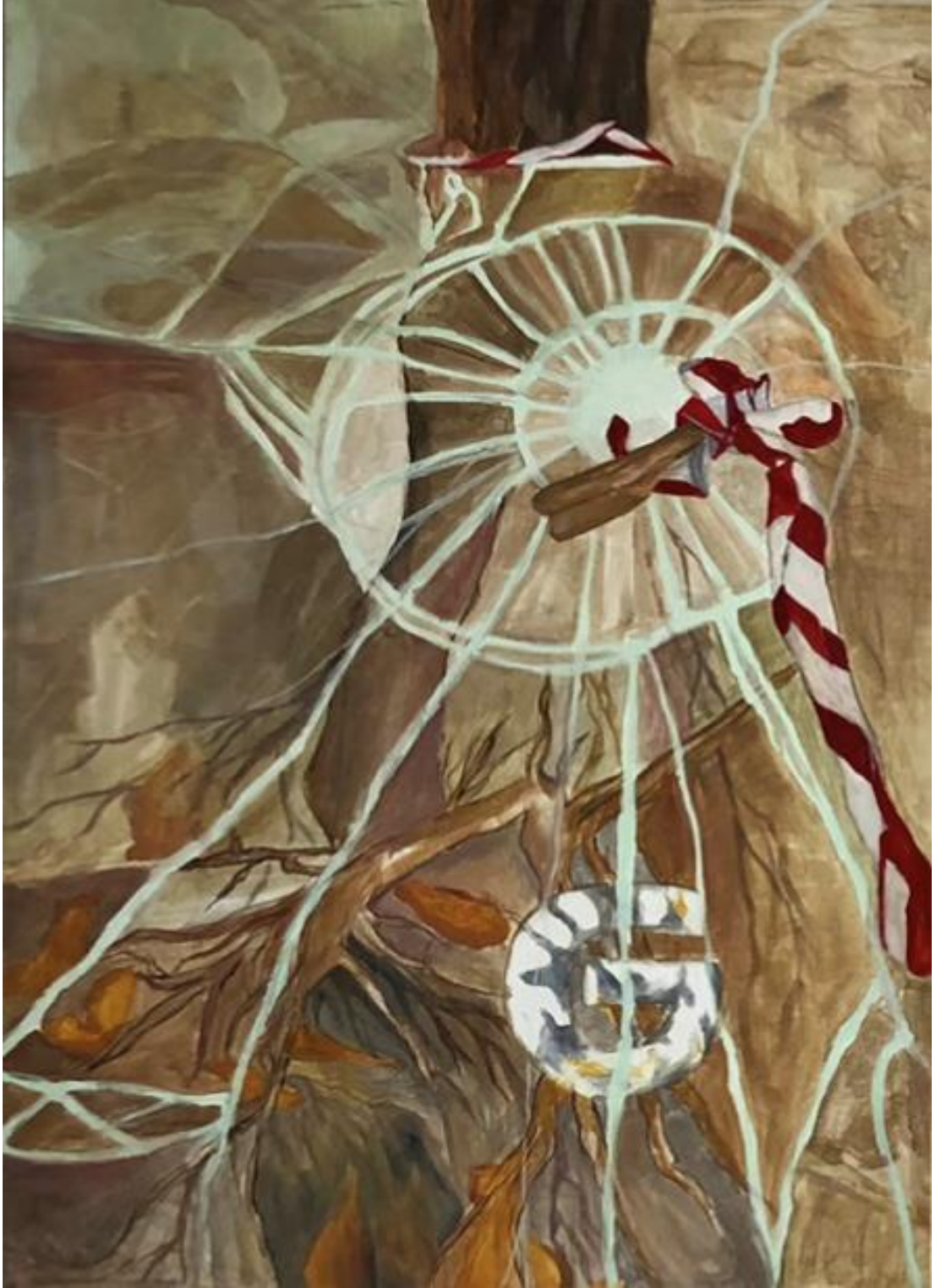
Resim 2.2. Edanur ALKAN, Ekolojik Duyarlilik I , Tuval üzerine yađlı boya, (100x70 cm.), 2023