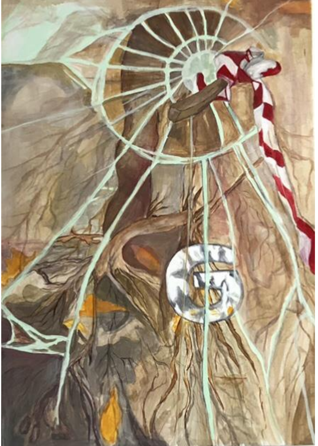
Resim 2.3. Edanur ALKAN, Ekolojik Duyarlılık II Tuval Üzerine Yağlı Boya ,(100x70 cm.), 2023