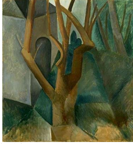
Resim 1.4. Pablo Picasso, Manzara,1908.

kübist sanat daha soyut hale geldi ve nesnelere daha fazla parçalara ayrılarak geometrik bir dil kullanıldı.