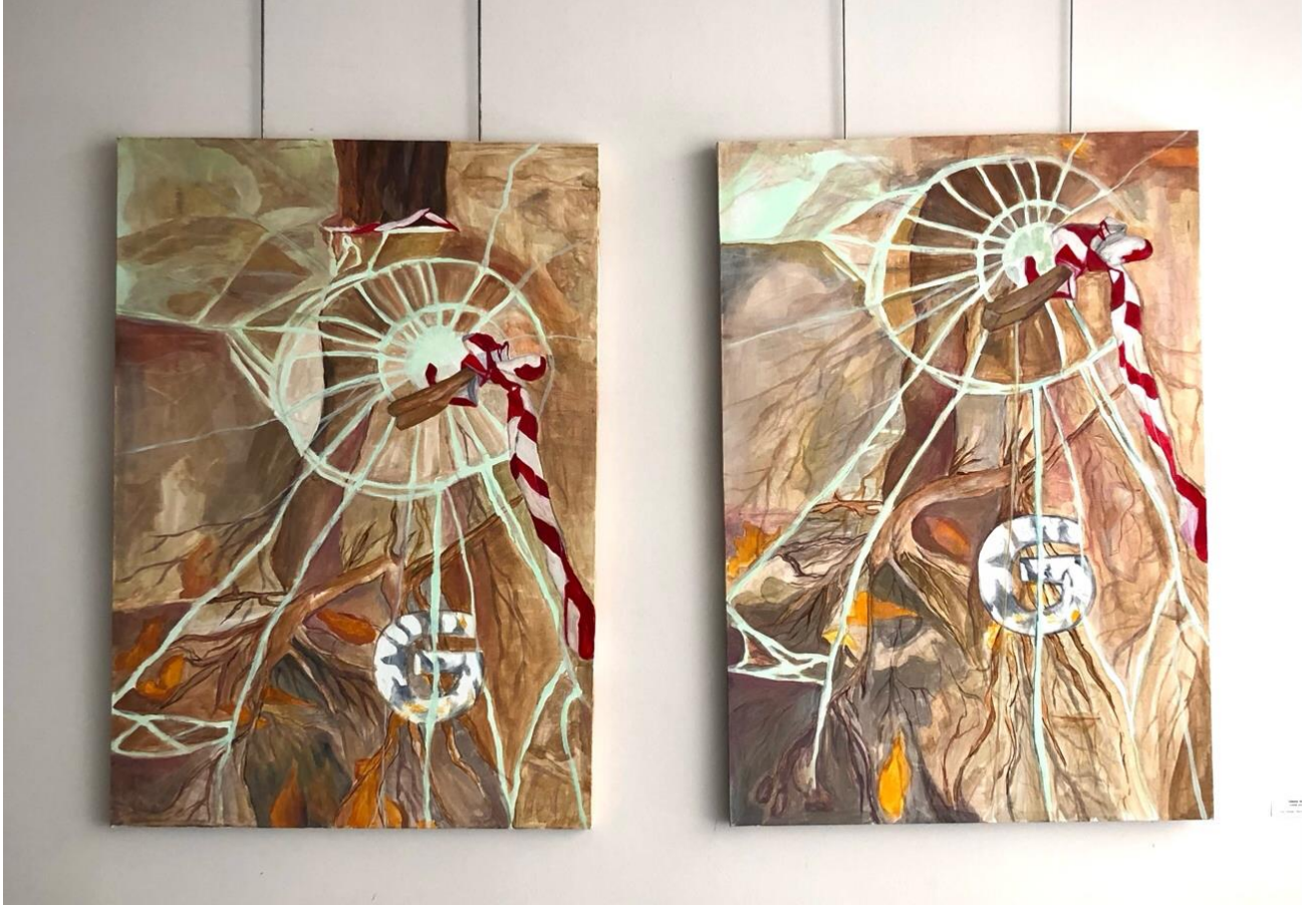
Resim 2.4. Mezuniyet Sergisinden Görünüm, Atatürk Üniversitesi, Güzel Sanatlar Fakültesi, Sergi Alanı, 2023