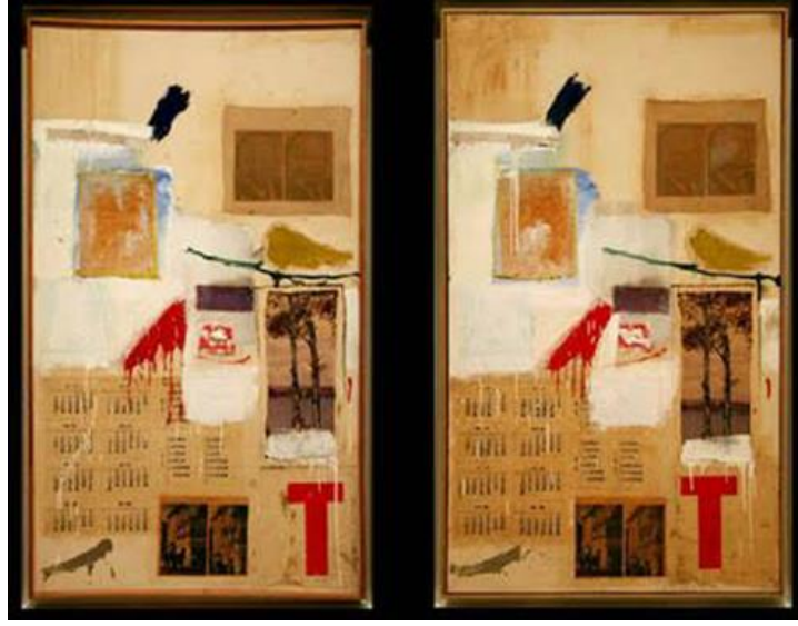
Resim2.1.R.Rauschenberg, Factum I ve Factum II ,1957

Çoğaltma, sanatçının dünya görüşü, sanatsal yönü ve felsefesiyle ilgili olarak kendini belirlemektedir. Çoğaltma bir sanatsal kategori değildir. Bir teknik olarak, bir imgeyi ya da düşünceyi görsel yolla aktarmada etkiyi güçlendiren bir öge olarak kullanırken, diğer yandan güçlü bir toplumsal eleştiri nesnelere olarak, toplumsal sistemin (tüketim toplumunun) ayna imgesi gibi de düşünülmektedir.