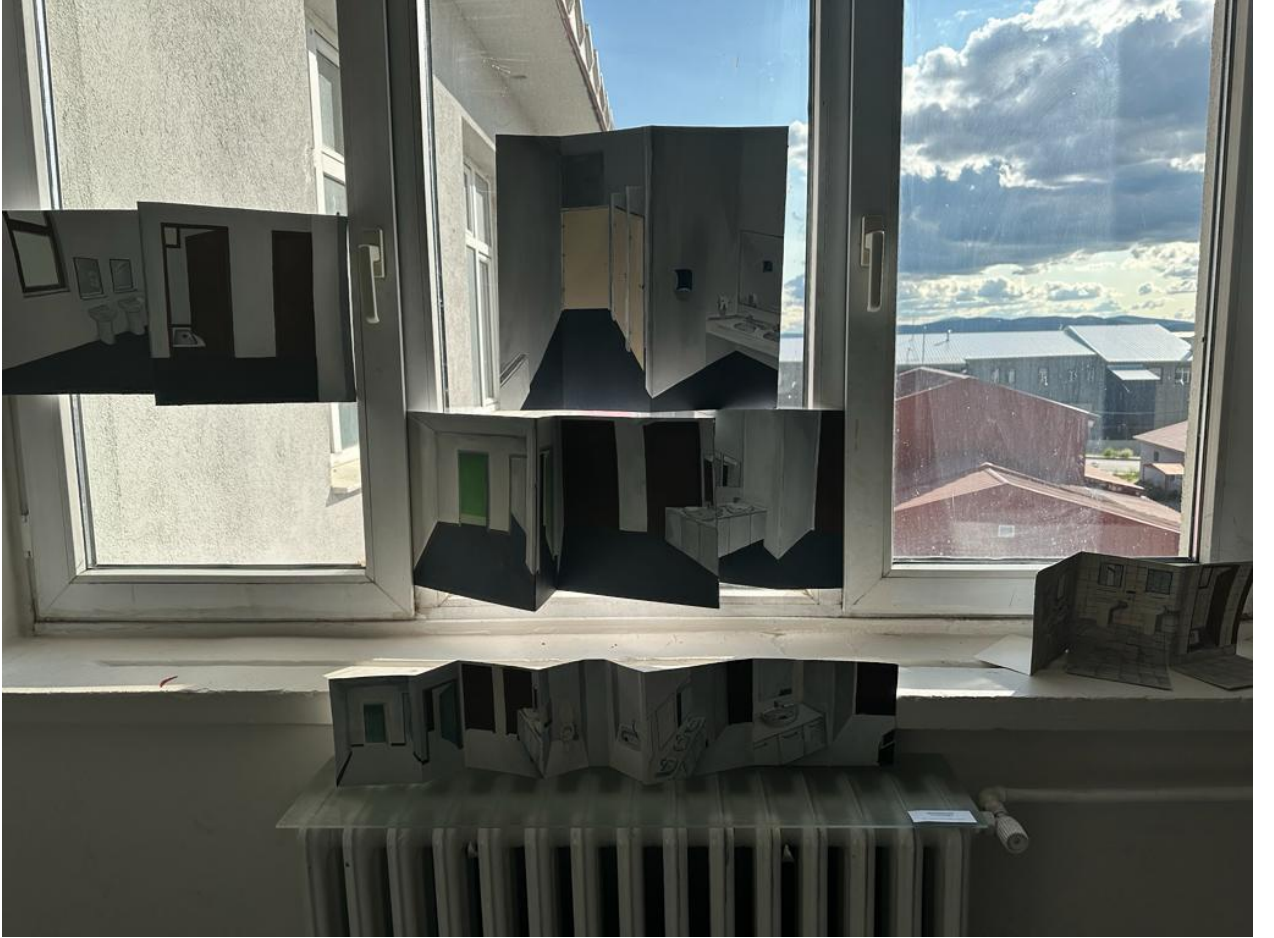
Resim2.5. “Mezuniyet Sergisi” Atatürk Üniversitesi, Güzel Sanatlar Fakültesi, Sergi Alanı, 2023