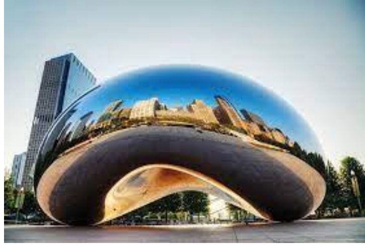
Resim1.1. Anish Kapoor, Bulut Kapısı, Chicago

Kentlerin, toplumların ve bireysel yaşamların önemli bir parçası olan kamusal alanlar, fiziksel, sosyal, psikososyal, ekonomik, sembolik, estetik ve politik birçok önemli role sahiptir. Kamusal alanın anlamı hem bütünlüğünde hem de çevresi ve iç parçalarıyla kurduğu ilişkilerde yatmaktadır. Kamusal sanat, bir kamusal alanı tanımlayan bir çalışma, bir kamusal alanda sergilenen sanatsal bir öge veya etkinlik veya hatta tüm bir kamusal alan olabilir.