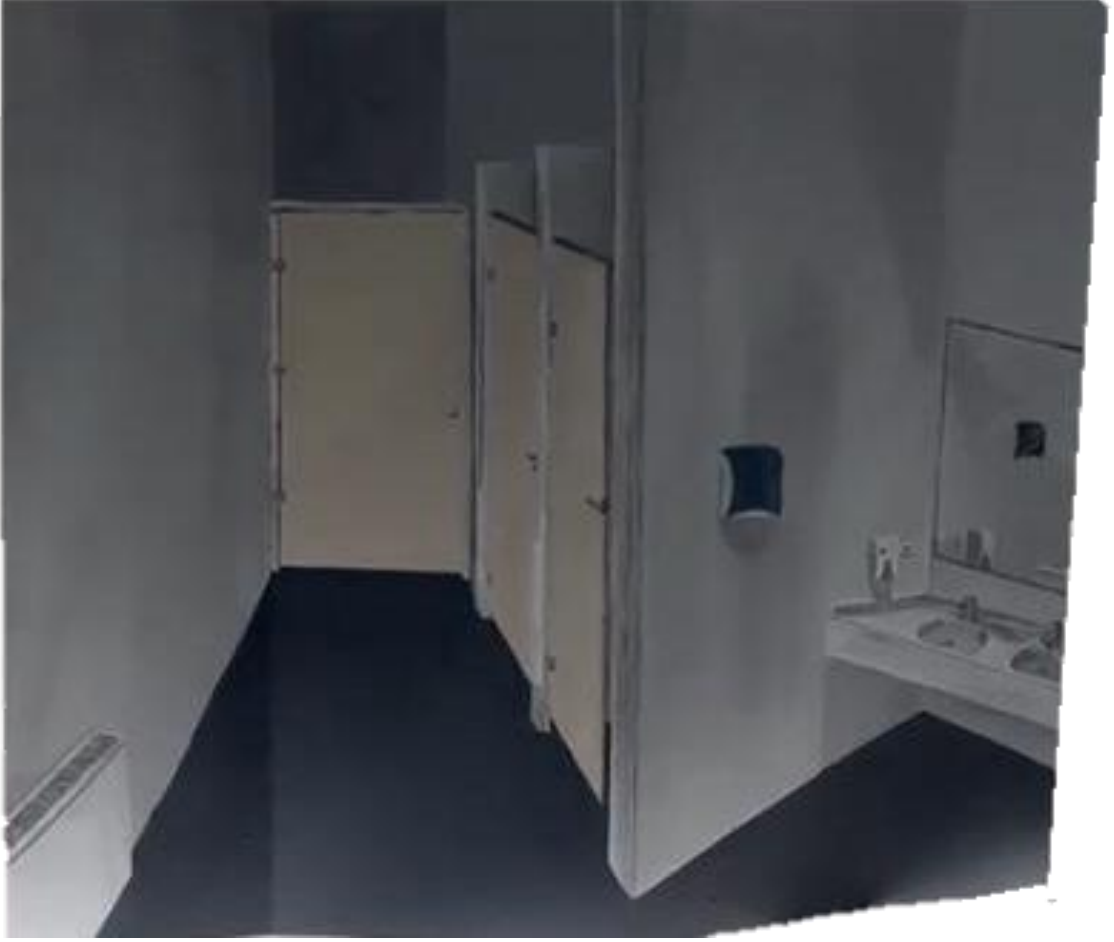
Resim 2.1. Hilal KARAYILAN, “Tuvalet”, kağıt üzerine akrilik boya, (50x40 cm),2023