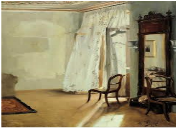
Resim1.3. Adolph Menzel ‘Balkon Odası’, 58x47 cm tuval üzerine yağlı boya

Adolph Friedrich Erdmann von Menzel (8 Aralık 1815 - 9 Şubat 1905), çizimler, gravürler ve resimlerle tanınan bir Alman Realist ressamdı. Caspar David Friedrich ile birlikte 19. yüzyılın en önemli iki Alman ressamından biri olarak kabul edilir ve döneminin Almanya'daki en başarılı sanatçısıydı. İlk olarak Adolph Menzel olarak bilinir, 1898'de şövalye ilan edilir ve adını Adolph von Menzel olarak değiştirir. Kendi başına resim sanatını incelemeye başlamıştır kısa sürede çok sayıda ve çeşitli resimler yapmaya başlamıştır. Bu çalışmalar içerisinde de mekân çalışmaları da yapmıştır.