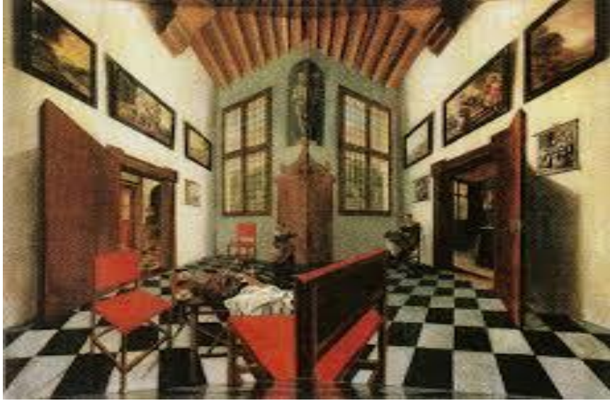
Resim1.4. Pieter Janssens Elinga 'Perspektif Kutusu'

Pieter Janssens Elinga (1623–1682), ağırlıklı olarak pencerelerin dikdörtgen geometrik öğelerine, yer karosu resimlerine ve diğer öğelere ve birkaç tür figürüne güçlü bir vurgu yapan iç mekân sahneleri olan Hollandalı bir Altın Çağ ressamıydı . Ayrıca natürmortlar da çizmiştir. Bugün en çok, hala bozulmamış olduğu bilinen 6 kutudan biri olan perspektif kutusuyla tanınır. Lahey'deki Bredius Müzesi'nde sergileniyor. Perspektif kutuları ışık, mimari öğeler ve camera obscura ile yapılan deneylerdi. Samuel van Hoogstraten de Ulusal Galeri'de sergilenmekte olan bir tane yaptı. Boyut ve çarpık perspektif göz önüne alındığında, Carel Fabritius'un küçük Delft Görünümü tablosunun orijinal olarak bir perspektif kutusunun parçası olduğu düşünülüyor.