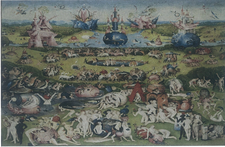
ÜTOPYS (THOMAS MORE)

ortaya çıkmış kendine özünü sıkıntıları da ortaya çıkarmıştır ve devlet için tehditler üelişmesine neden olmuştur. Kapitalist üretim bazı işçi sınıfını zenginleştirirken bazılarını yoksulluğa, fakirliğe sürüklemiştir. Kendisi ve hakimiyeti altındaki devlete verici veren tarımsal üretimler yapan zengin kesimler sanayini üelişmesiyle üretim ücretli işçiler tarafından yapılmıştır. Üretimden üelen üelirlerin eşit dağıtılmaması işçi sınıfları arasında üelir farklılıkları yaşanmasına sebep olmuştur. Yoksullaşan bu işçi sınıfının mutsuzlaşması üiderek büyük bir sorun haline üelmiştir. Bu anlamda 18. ve 19. yüzyıllarda ekonomi sıkıntılar daha yaygın hale üelmiştir ve bu yoksullaşma yoksul kesimlerin isyanları sistemi tehdit etmeye başladığı döneme denk üelmiştir. Bu yüzyılın ana konusu kapitalizmin bu bunalımı nasıl aşabileceği, kurtulabileceği konusunda üelişmiştir. Ve bu kapitalizmin bitmeyen sorunu haline üelmiştir.