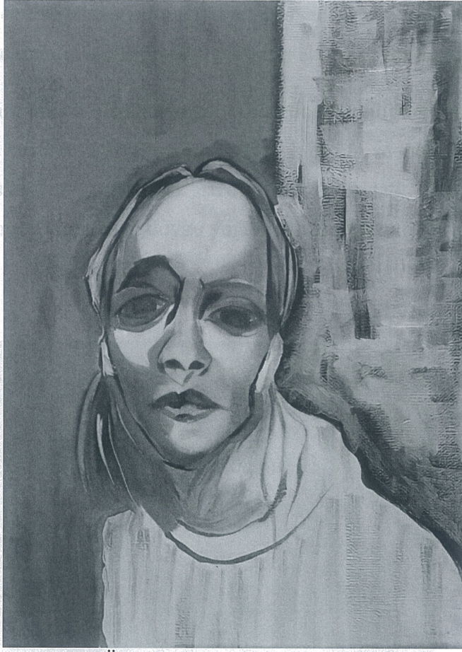
Tuval Üzerine Akrilik 35x50 "Arka Plan"

Bu resmi yaparken oldukça ilginç bir düşünsel yönü olan soyut bir sanat eseri olmasını istedim. Resmimde ki kadın portresini ruh hastalıkları bağlamında yüz ifadesine dikkat çekmek için gözlerin kullanımı ve gölgelendirme tekniğini soyut dışavurum akımına bağlı kalarak ifade etmeye çalıştım. Renklerin yumuşak ve romantik bir hava kattığını düşünerek, solgunluğu veya dinginliği bazen depresyon belirtisi olarak yorumlanabilir. Resimdeki çizgiler ve renkler, estetik açıdan uyumlu olmakla birlikte insan zihninde farklı duygular ve düşünceler çağrıştırmalarını amaçladım. Bu portre çalışmamda yüz ifadesi birçok farklı duyguyu yansıtıyor. Örneğin, hüznü veya endişeli olabileceği gibi, aynı zamanda kırılğan ve hassas bir ruh halini de temsil ediyor.