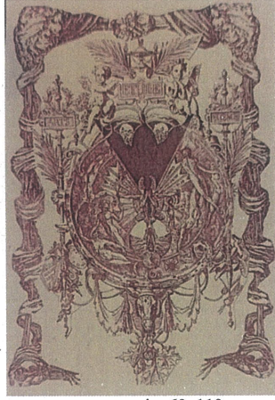
Ruhun Çemberi,Dijital Çizim,60x110.