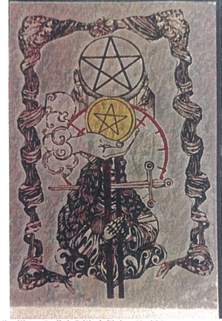
Bilgelik ve Bolluk,Dijital Çizim,60x110