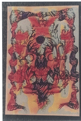
Bağlı Varlık,Dijital Çizim,60x110.