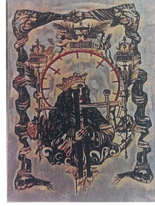
Bilgelğin Çiçeği,Dijital Çizim,60x110.