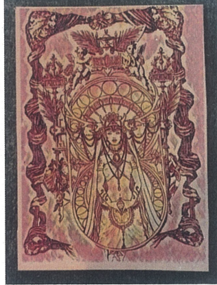
Doğan Kollayan Kadın,Dijital Çizim ,60x110.