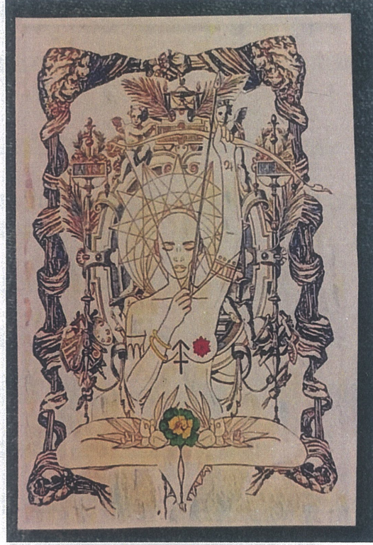
Gizemli Güzellik,Dijital Çizim,60x110