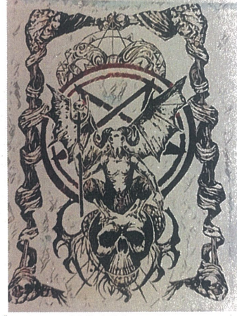
Ölümün Kuvveti,Dijital Çizim,60x110