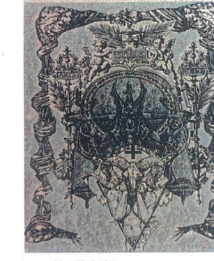
Kutsal Karşıtlık,Dijital Çizim,60x110