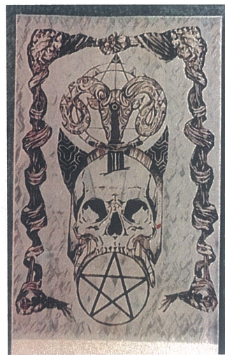
Zamanın Dokuzu,Dijital Çizim,60x110