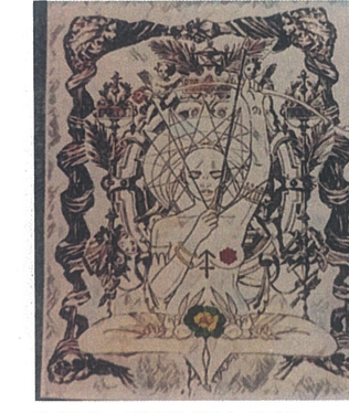
Çıplak Gerçeklik,Dijital Çizim,60x110.