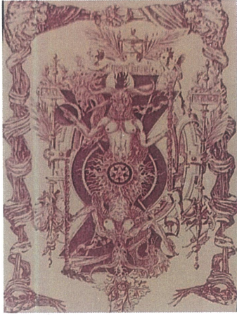
Çiçe Baktı,Dijital Çizim,60x110.