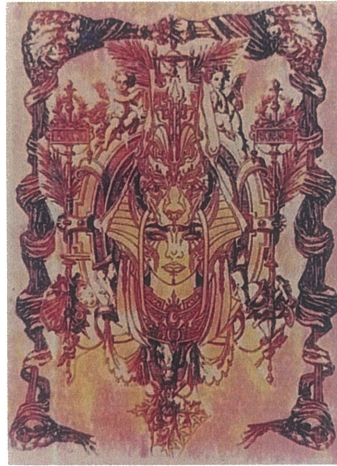
Güçlü Dişi,Dijital Çizim,60x110.