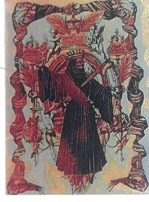
Son Karar,Dijital Çizim,60x110