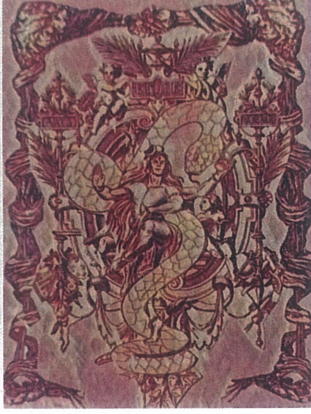
Büyülü Uyum,Dijital Çizim,60x110.