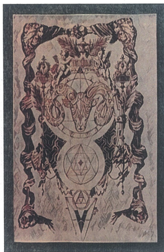
Zamanın Dokuzu,Dijital Çizim,60x110.