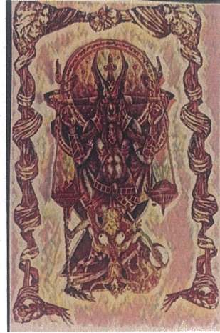
Denge ve Bozulma,Dijital Çizim,60x110.