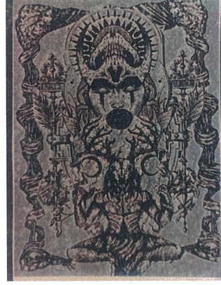
Altın Cehennem,Dijital Çizim,60x110.