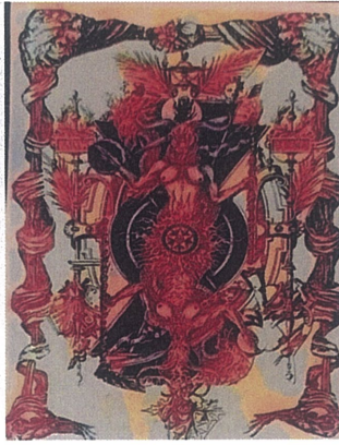
Şeyranın İki Yüzü,Dijital Çizim,60x110.