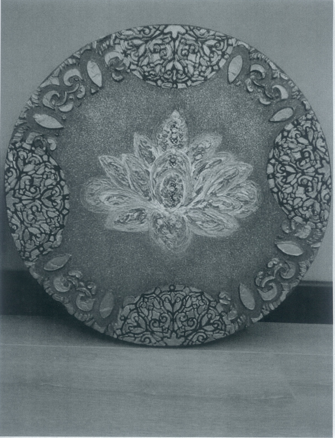
Büyük boy tuval 50*50 cm