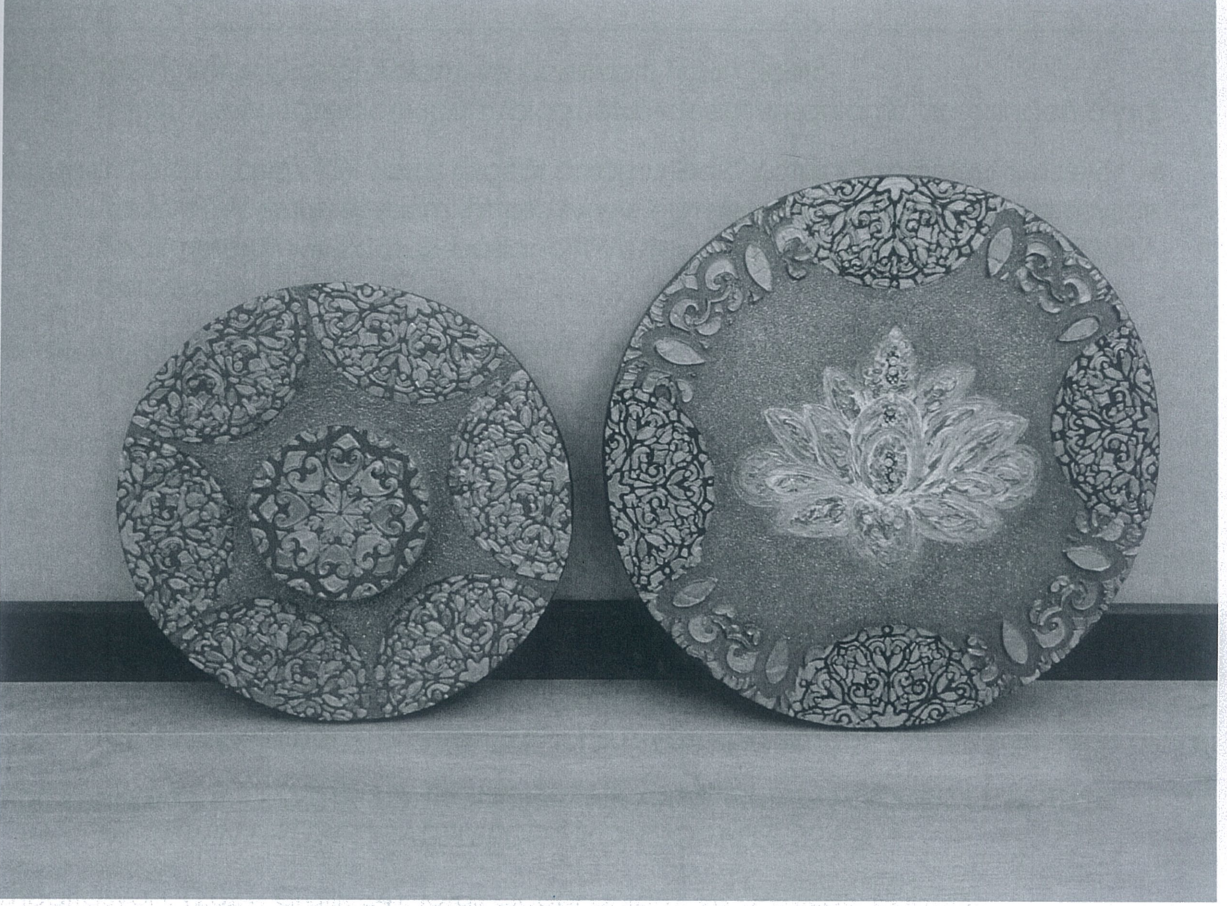
Hüma Alemdar "ÇAKRAL SERİSİ" Tuval üzerine *Rölyef tekniği,Yagli boya *2023