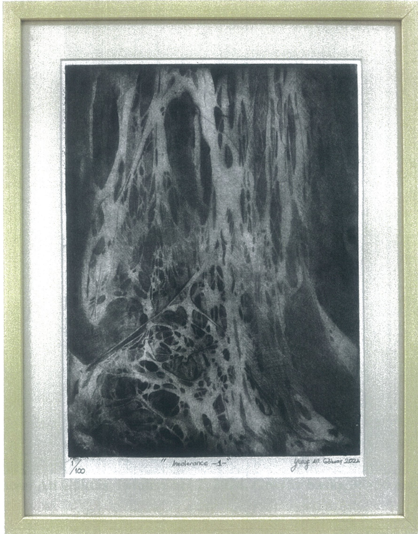
Yusuf Ali Göktaş, Intolerance 1, 2024, Gravür baskı, 35×50 cm