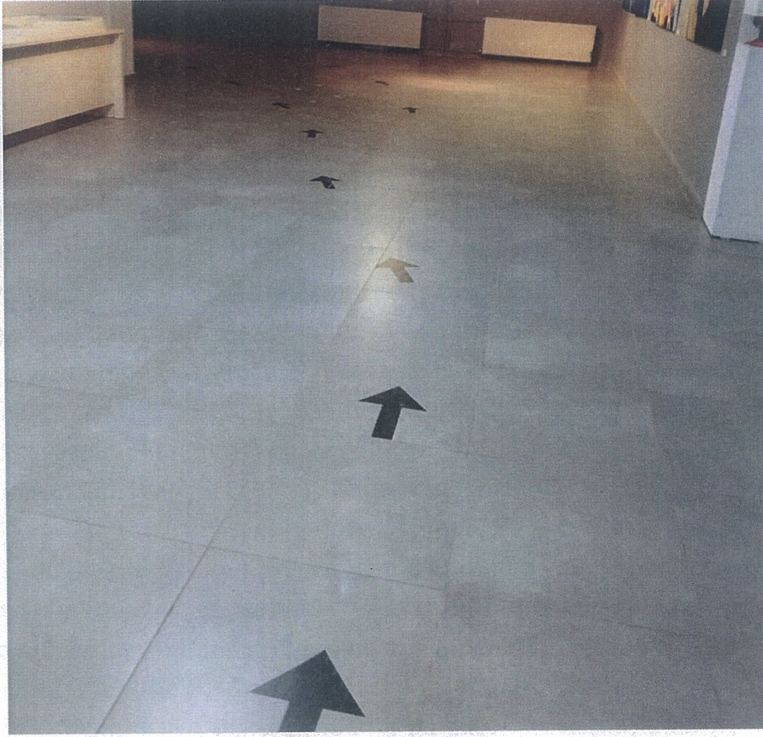
Kürsüye giden oklar