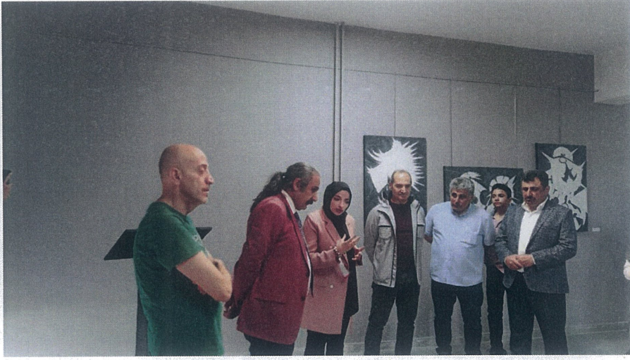
Proje sunum anı I