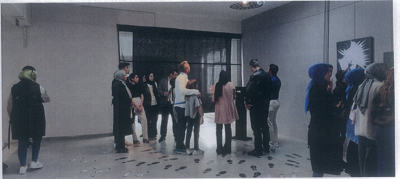
Kürsü önünde toplanan ziyaretçiler projenin bir parçası haline geldiler