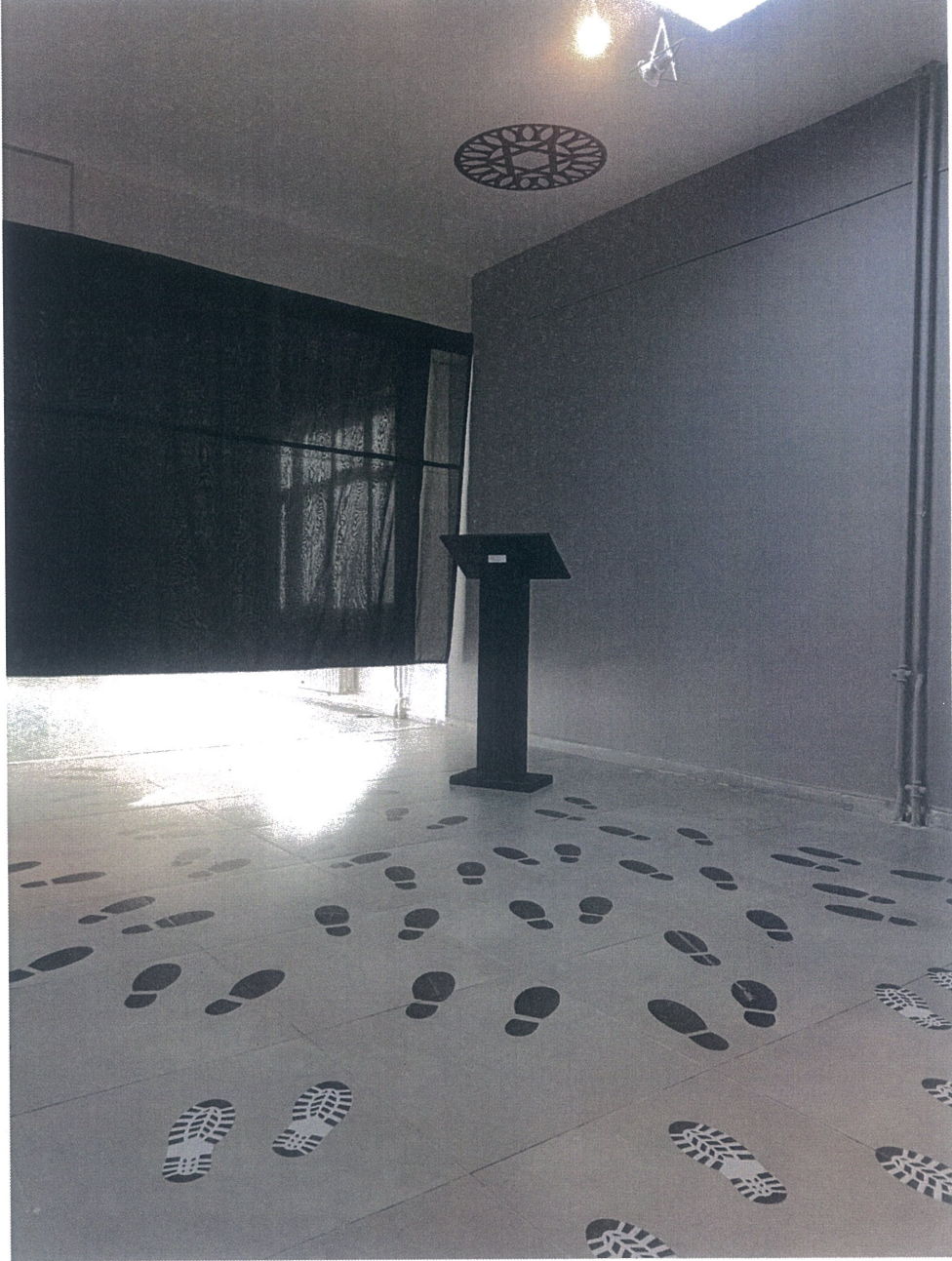
Temsili ayak izleri, kürsü ve Davud Yıldızı

ile hem seyircilerde bir farkındalık oluşturulmaya çalışıldı hem de bu kapitalist sistemin hiç sorgulamadan bir kölesi haline geldikleri için yargılanmış oldular. Proje kürsünün önüne toplanan insanlarla bir bütün haline geldi ve verilmek istenen mesajı tamamladı.