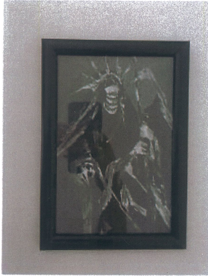
Rukiye Tahtalı 'İsimsiz '2025