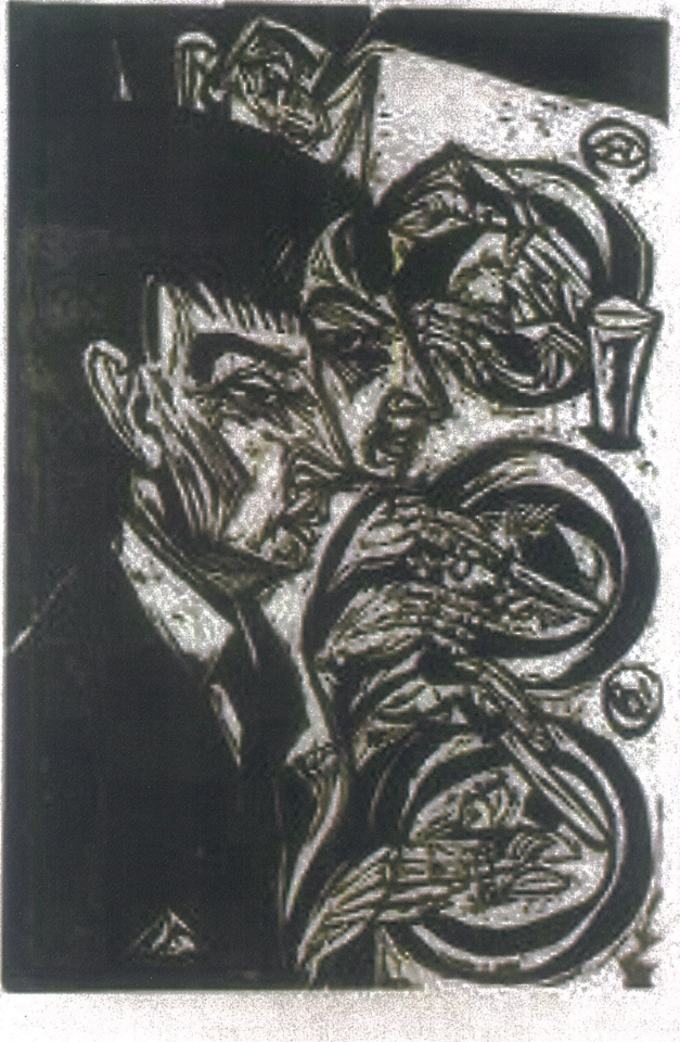
Şekil 6. Ernst Ludwig Kirchner, Nervous People Eating (Sanatorium Kohnstamm), 1916, Woodcut on paper. 30,7 x 44,5 cm

karakteristik özelliği olan abartılı, engebeli formlar ve kaligrafik şeritleriyle başlığın gerginlik önerisiyle uyumlu olarak yoğun duygu ve huzursuzluk vermektedir. Figürlerin keskin yüz hatları ve vücutlarının dinamik, neredeyse kaotik düzenlemesi, gerginlik ve iç dünyasını yansıtmaya da katkıda bulunuyor.