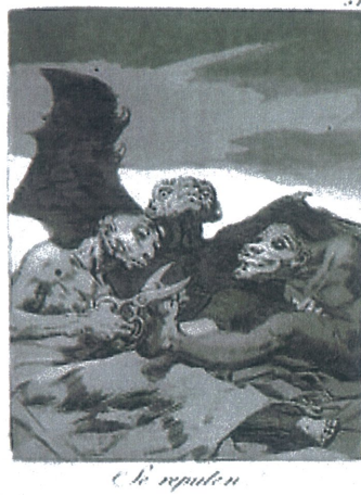
Şekil 1. Los Caprichos, no: 72 No te escaparàs (Kaçamayacaksın), Aside yedirme baskı, perdahlanmış leke baskı. Los Caprichos, no: 51 Se repulen (Kendilerine çekidüzen veriyorlar), Aside yedirme baskı, perdahlanmış leke baskı ve çelik kalem.