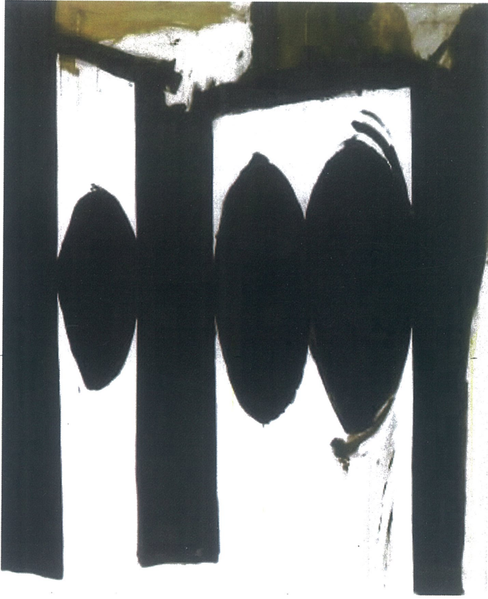
Şekil 4. İspanya Cumhuriyeti'ne Ağıt – Elegy To The Spanish Republic Tarih: 1961, Orijinal Boyut: 178 X 229 Cm,

Bu seri hem içerik hem duyarlılık açısından Motherwell'in estetik anlayışını siyasi duyarlılığını felsefi görüşünü bildirir. Motherwell'in siyah beyaz çalışmalarında sadece estetik bir tercih değil aslında hem ölüm yas ve de direnişin simgesel bir ifadesidir. 'Elegy' serisindeki siyah beyaz dikey formlar tradejiyi bastırılmışlığı temsil ederken arka kısımdaki beyaz ise umudu sessizliği anlatmaktadır. Motherwell'in siyah beyaz paletlin sırrı yoğun bir duygusalığa yük olmuştur. Sınırlı renk kullanımı Kompozisyo'nun ritmik ve biçimsel anlamın gücüne odaklanmamızı sağlar. İspanya İç Savaşında Motherwell tarihsel olayları soyutlaştırarak ve biçimleri yansıtarak politik bilinçaltı yaratır. Siyah Beyaz'ın anlamları iyilik ve kötülüğü kaos ve ölümü yaşam ve düzeni gibi felsefi düzeni çağırıştırır.