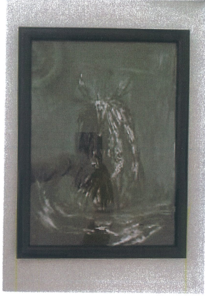
Rukiye Tahtalı 'İsimsiz' 2025