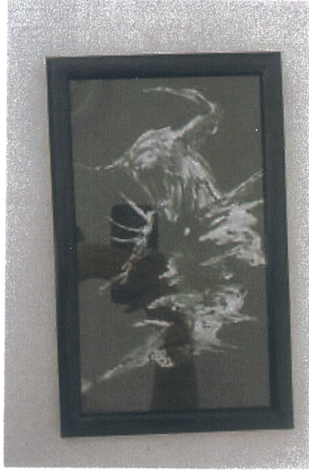
Rukiye Tahtalı 'İsimsiz' 2025