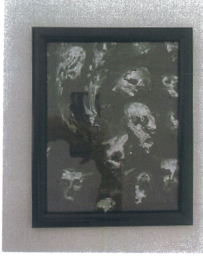
Rukiye Tahtalı 'Ritüel'(70x100),2025