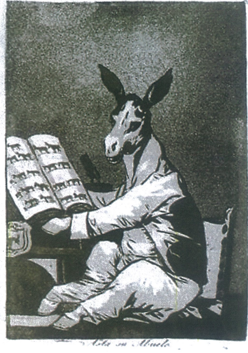
Şekil 2. Los Caprichos , no: 32 Por que fu sensible (Çünkü Duygusalı), Leke baskı. Los Caprichos , no: 39 Asta su abuelo (Dedesi Bile), Leke baskı. Baransel

Francisco Goya'nın "Los Caprichos" isimli serisine baktığımız da ki içinde barındırdığı hayaller, dünya dışı varlıklar, rüyalar ve fantastik olan bu eserler serinin içerisinde de gerçekleştirilmiş olmakla birlikte eskizler ve bu eskizlere konulan başlıklar, net bir şekilde ortaya koymaktadır. Bu başlıklar da anlatılmak istenen öncelikle rüyalar, sonrasında evrensel dil teması altında sıralanmış ve düşünülmüş şekilde çalışma serisinin ilk gravürü, ilk olarak "Rüya gören sanatçı" olarak belirlenmesi düşünülen, şu an ise "El sueño de la razon produce monstros" (Aklın uykusu canavarlar doğurur) ismiyle bilinen bir sanat eseri olarak gerçekleşecekti. Söz konusu olan gravür ve bu gravürü takip eden gravürlerde, sanatçının -ya da aklın- uykuya geçmesinin ardından karanlıklar krallığının kapıları açılarak içinden şeytanlar, cadılar, cinler, canavarlar çıkacaktır. Baudelaire'in söylemiyle bu cadılar gerçekte insana özgü olan bütün karanlık tarafların beden bulmasından ötürü başka bir şey değildir (Baransel, 2012, "Goya: Zamanının Tanığı-Gravürler ve Resimler" ya da Hayallere Özgürlük!).