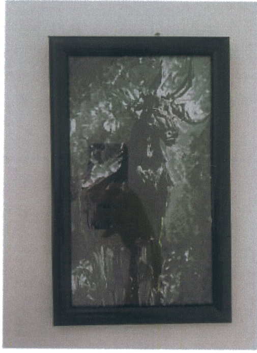
Rukiye Tahtalı 'İsimsiz' 2025