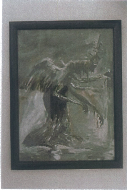
Rukiye Tahtalı 'İsimsiz' 2025