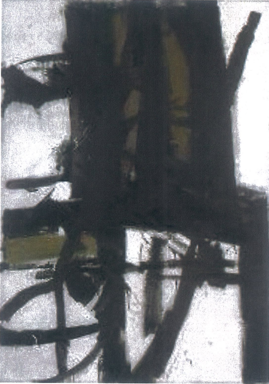
Şekil 3. Franz Kline, "The Bridge" (Köprü), 1955, 208,5x138,5 cm. T.Ü.Y.B. MunsonWilliams-Proctor Arts Institute Utica, New York

Sanatçı ilk eserlerinde toplumcu gerçekçi ve figüratif tarzda eserler yapan Franz Kline 1950'li yıllardan sonra beyaz üzerine siyah kompozisyondan oluşan soyut resimlere geçiş yapmaktadır. Resimlere baktığımız da daha yalın ve renksiz olma özelliklerinin ön planda olduğu görülmektedir. (Yılmaz, 2013, s. 233).Kline, trenlerin hızlı hareketlerinden hoşlanmakta ve eserlerini de buna göre siyah beyaz resimler de bu hareketlilikten devam ederek hızlı bir şekilde çalışmalarını yapmıştır. Eserlerine baktığımızda Sanatçı, siyah boyanın ardından tuval üzerine attığı beyaz fırça darbeleri ile siyah boyanın bazı kısımlarının hareketliliğini keserek düşüncenin açığa çıkmasını amaçlamıştır aslında.