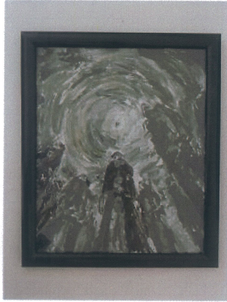
Rukiye Tahtalı 'İsimsiz' 2025