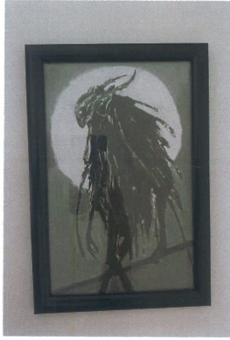
Rukiye Tahtalı 'İsimsiz' 2025