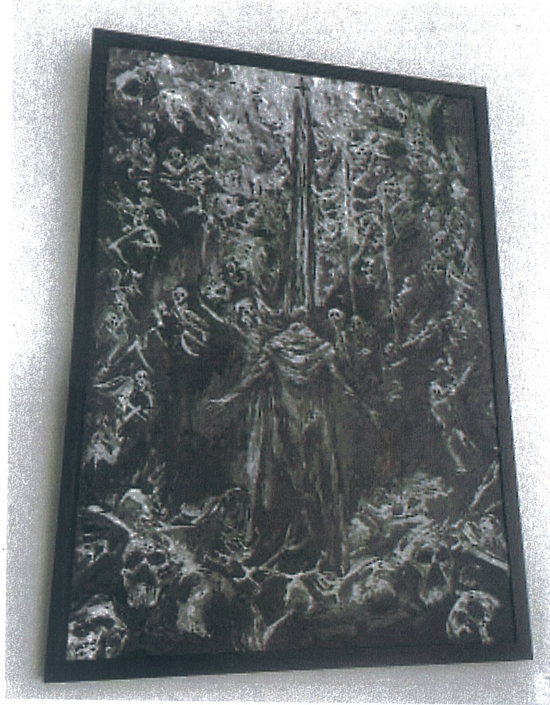
Rukiye Tahtalı 'İsimsiz' 2025