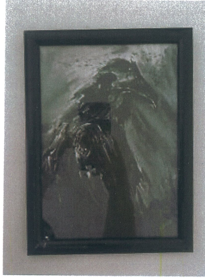
Rukiye Tahtalı 'İsimsiz' 2025