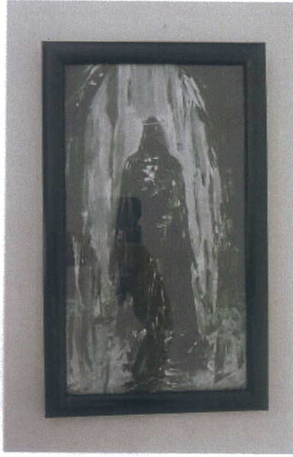
Rukiye Tahtalı 'İsimsiz' 2025