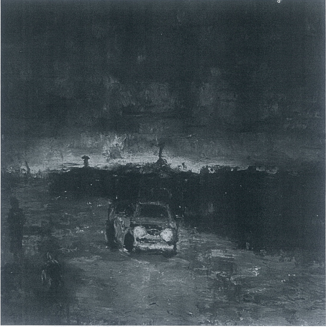
Töre ÖNER, İsimsiz,2025, 20x20, Yağlı Pastel