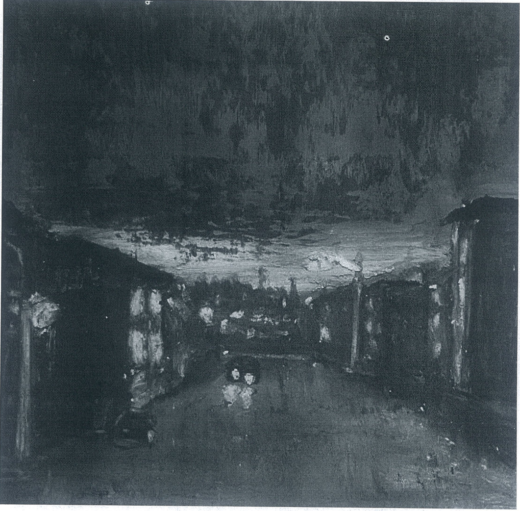
Töre ÖNER, İsimsiz, 2025,15x15, Yağlı Pastel