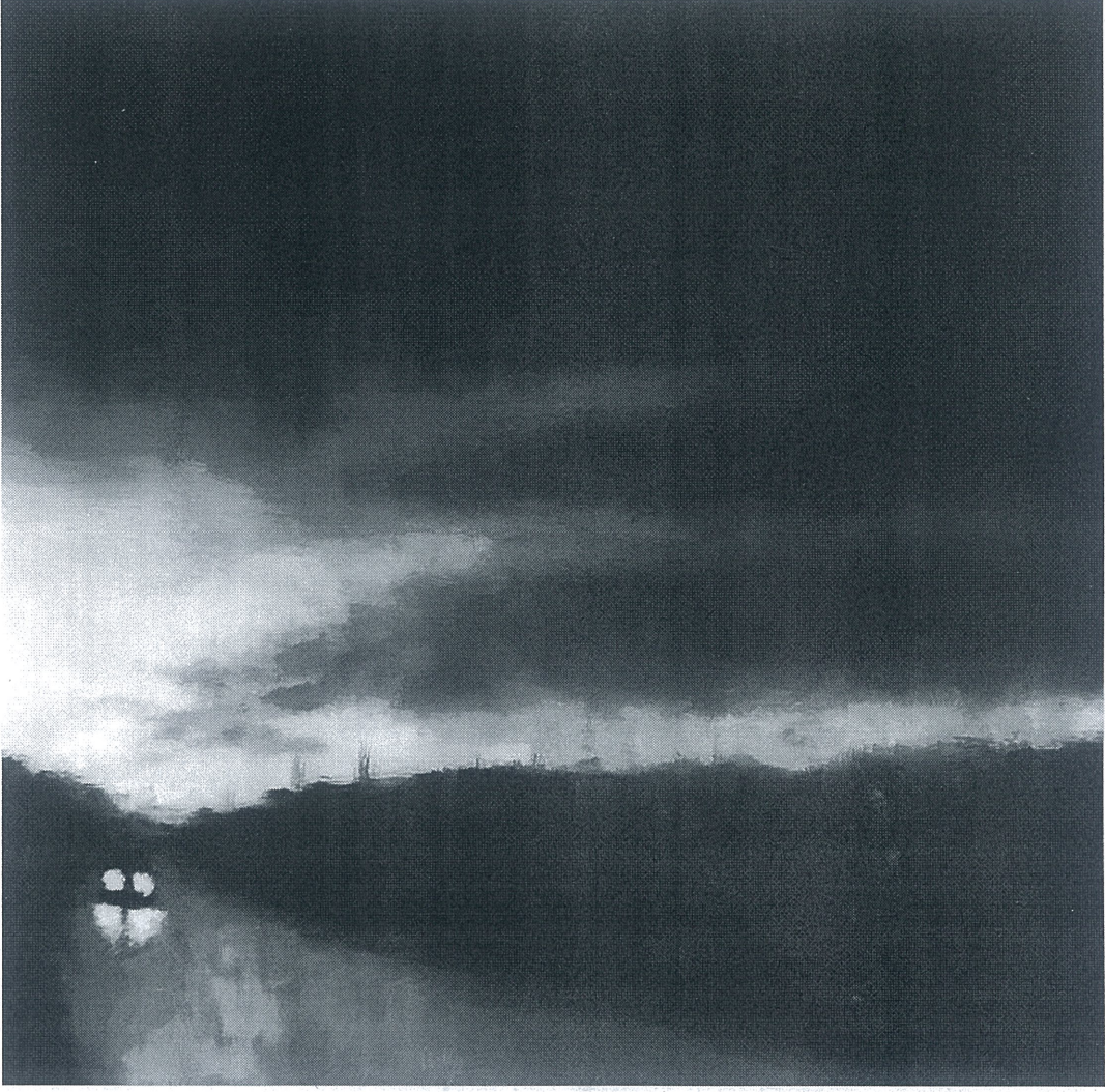
Töre ÖNER "Muğlak 2",2025, 45x45, Tuval Üzerine Yağlı Boya