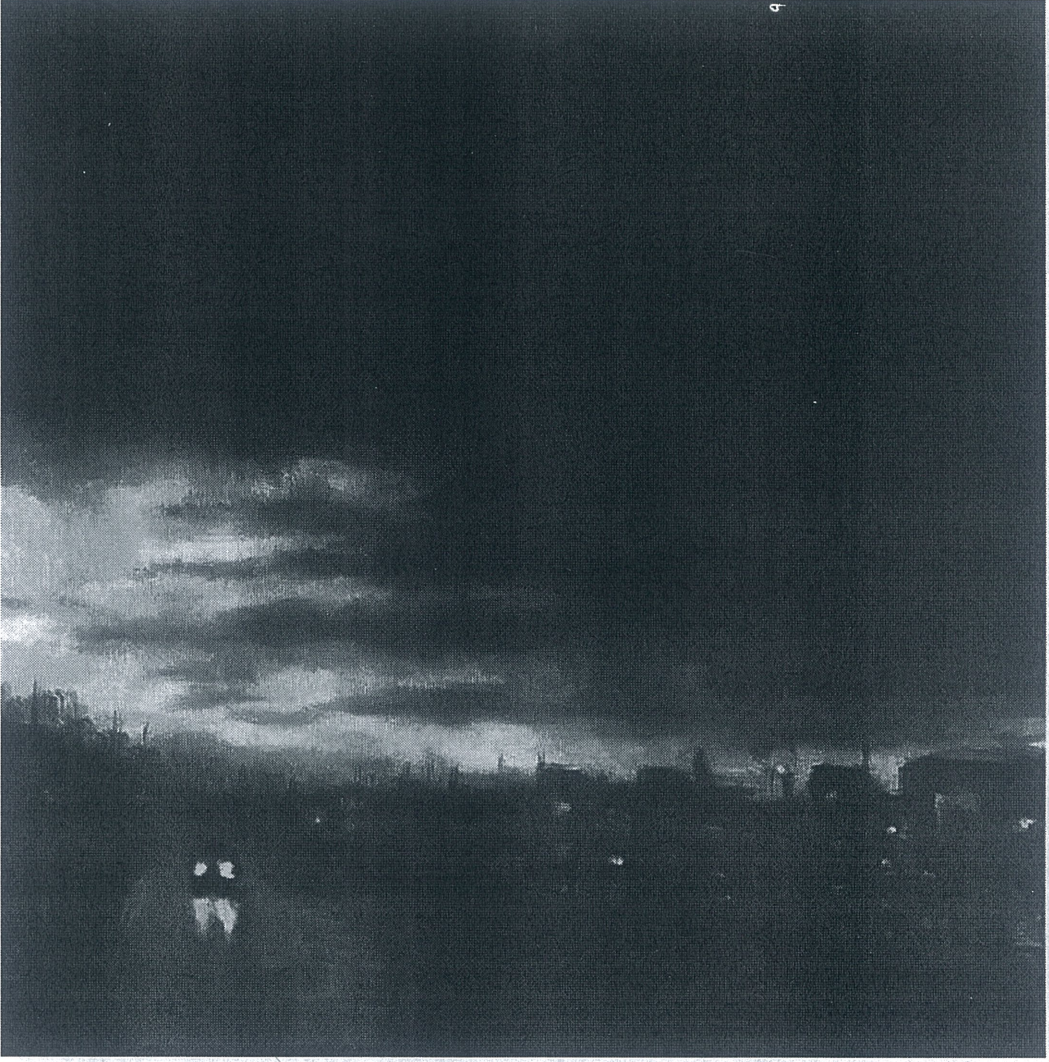
Töre ÖNER “Muğlak 3”,2025, 45x45, Tuval Üzerine Yağlı Boya