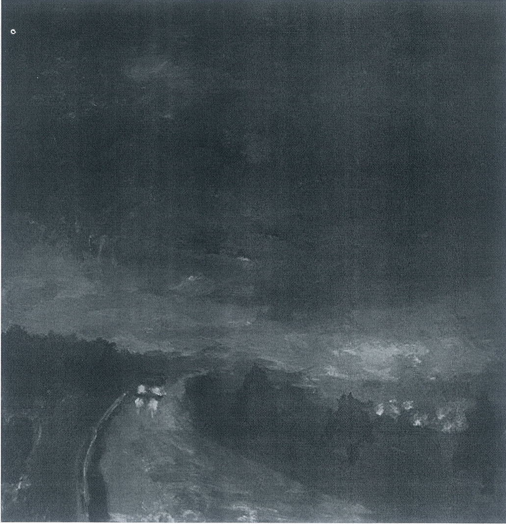
Töre ÖNER, İsimsiz, 2025,16x16, Yağlı Boya