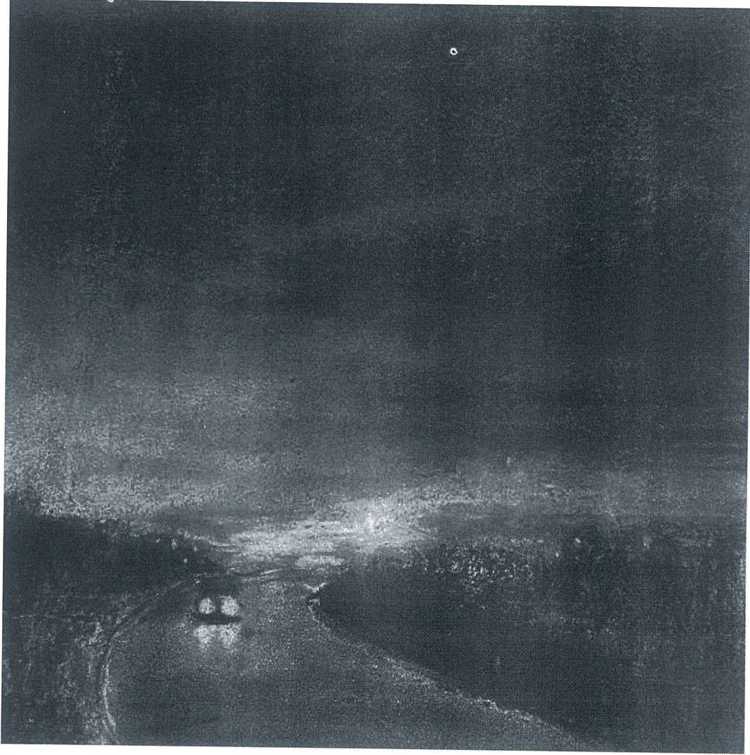
Töre ÖNER, İsimsiz,2025, 25x25, Toz Pastel