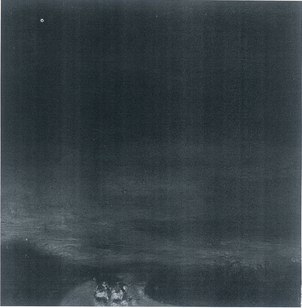
Töre ÖNER, İsimsiz,2025, 15x15, Yağlı Pastel