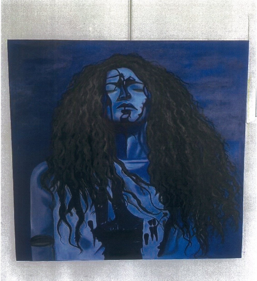
Resim 2. Kardelen Özden, Tuval Üzerine Yağlı Boya Soraya'yı Tanımak, 2025