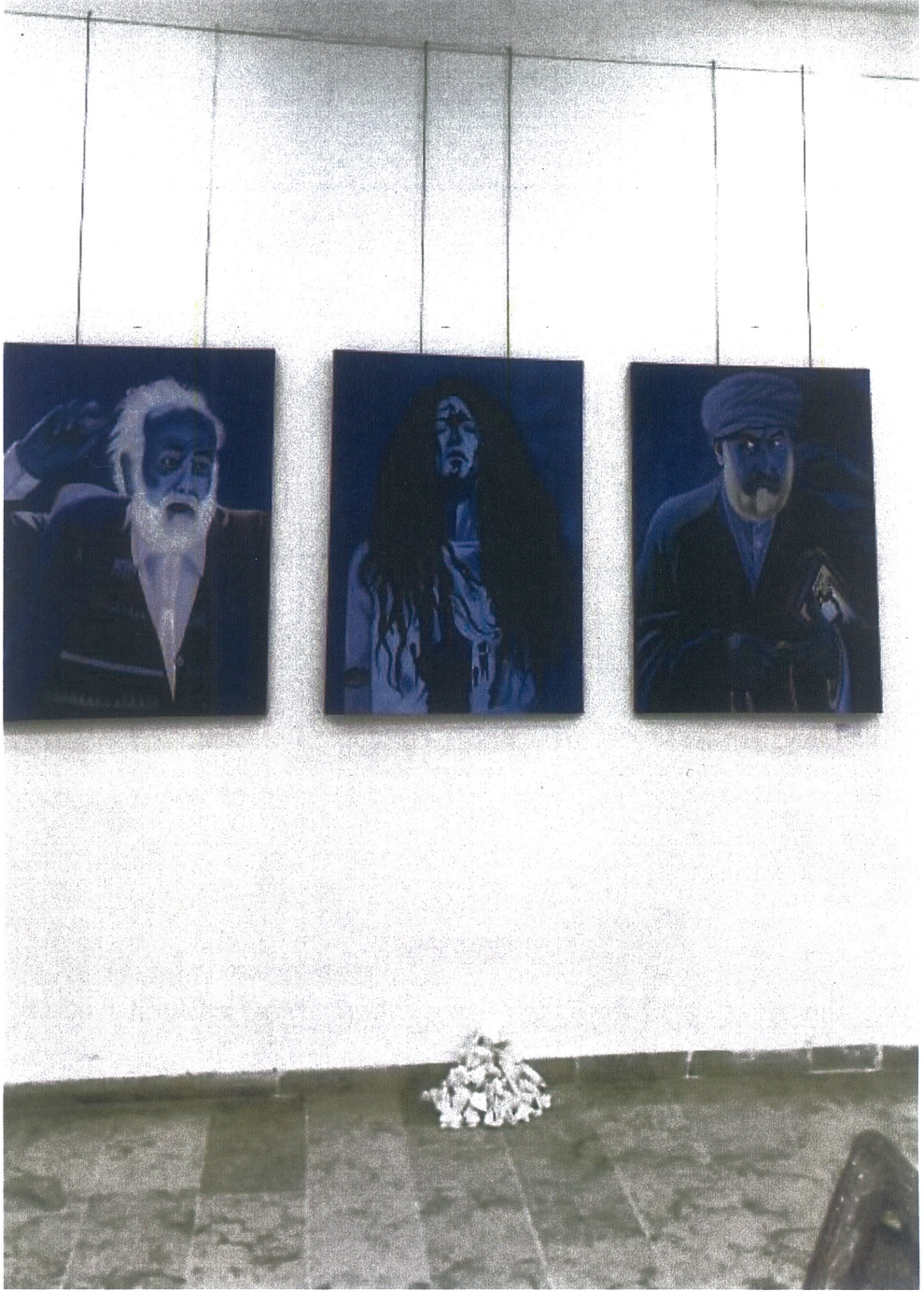
Resim 5. Kardelen Özden, Tuval Üzerine Yağlı Boya Soraya'yı Tanımak, 2025