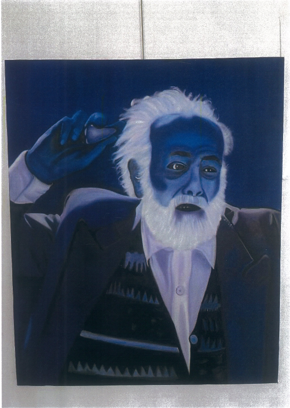
Resim 4. Kardelen Özden, Tuval Üzerine Yağlı Boya Soraya'yı Tanımak, 2025