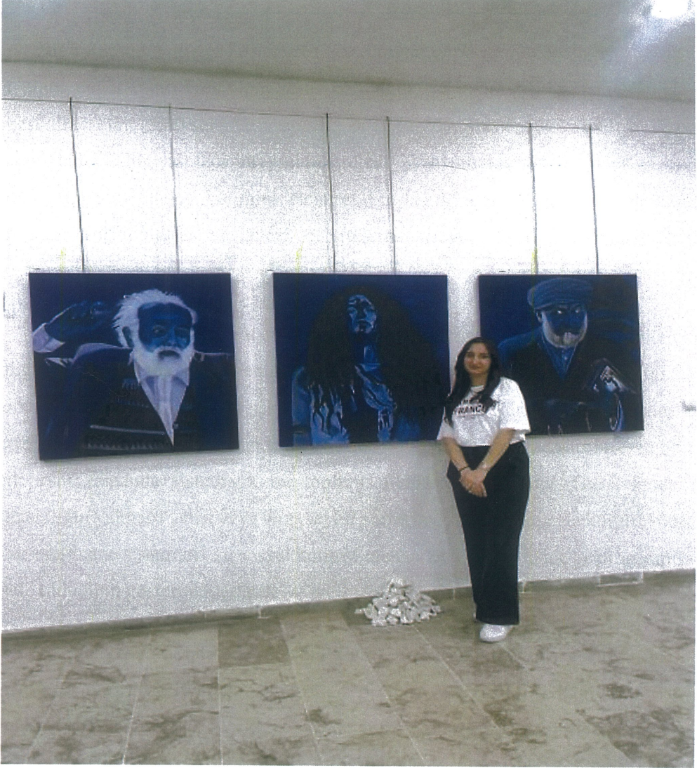
Resim 6. Kardelen Özden, Tuval Üzerine Yağlı Boya Soraya'yı Tanımak, 2025