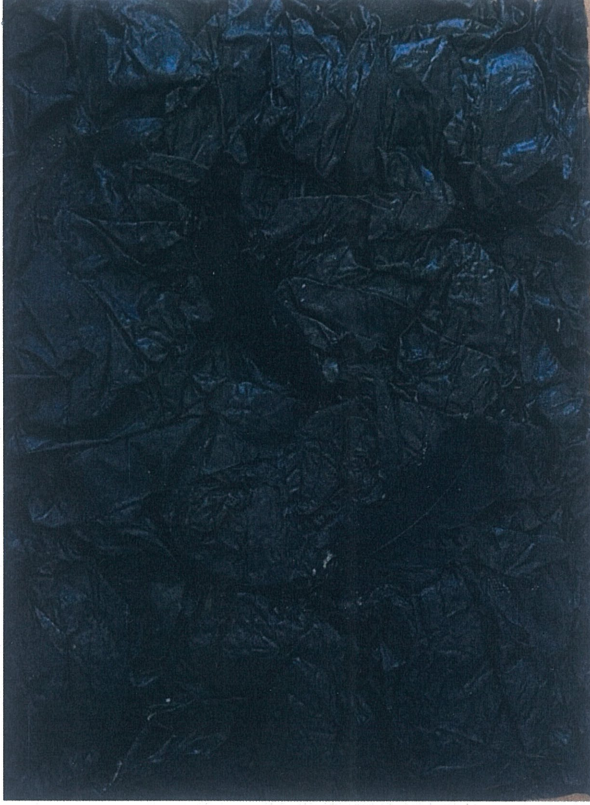
Şekil 12 Ergin, A. (2025). Katman (Akrilik )35x50