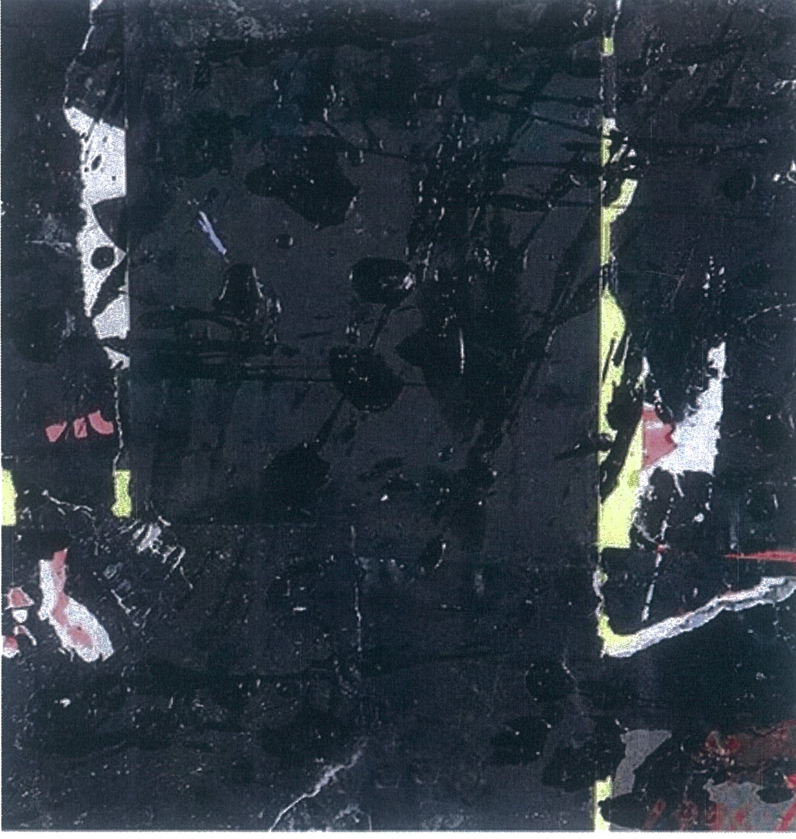
Şekil 8 Burhan Doğançay, “Alexander’s Night” – Alexander Duvarları Serisi; 1996

Doğançay’ın 1995-2000 yılları arasında ürettiği “Alexander’ın Duvarları” serisi, ilhamını New York’ta bir zamanlar popüler olan Alexander’s alışveriş merkezinden almaktadır. Alışveriş merkezi kapanınca dış cephesi tahtalarla kapatılmış, afişlerle kaplanmış ve ardından siyah kağıt boya ile kaplanmıştır. Doğançay, duvarlardaki siyah kağıda yapılan müdahaleleri sanki bir bahçede çiçekler açıyormuş gibi algıladığını belirtmiş ve bu duygudan ilham alarak, duvarların zamanla nasıl değiştiğini ve duygusal izler bıraktığını ifade eden “Alexander’ın Duvarları” serisini yapmıştır.