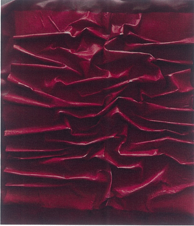
Şekil 14 Ergin, A. (2025). Katman (Akrilik )35x50