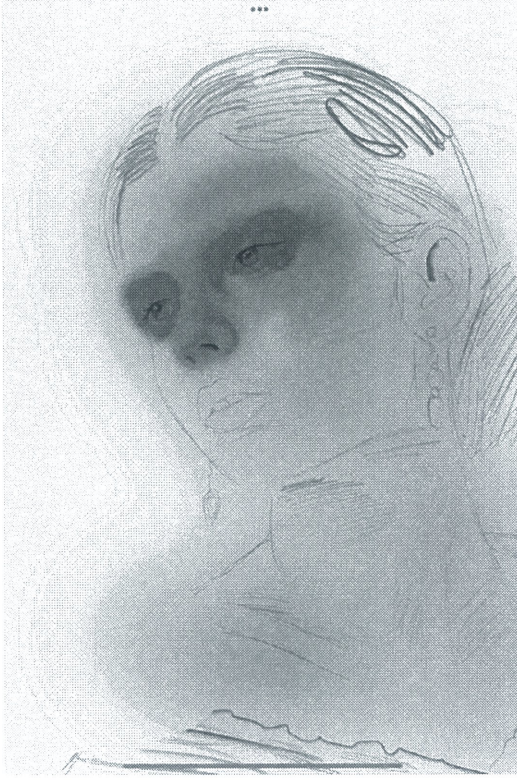
Şekil 5 Vildan KOLA, Dijital Zerafet,2025, Dijital Çizim, 1 dk 17 sn