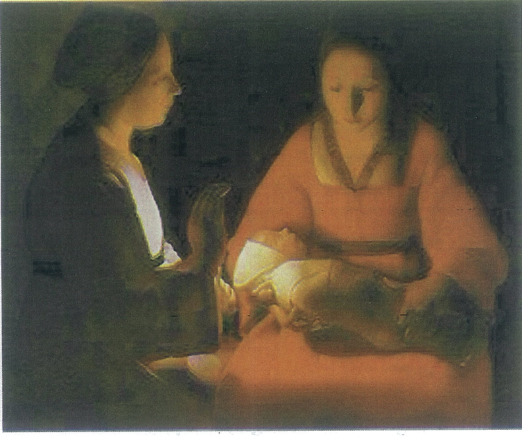
(1.5.) Georges de La tour, Yeni Doğan Mesih, tuval üzerine yağlıboya 76 cm × 91 cm. Rennes Güzel Sanatlar Müzesi,Fransa

Georges de La Tour'un "Yeni Doğan Mesih" (İngilizce: "The Newborn Christ"), 1645 civarında yapılmış önemli bir tablosudur. Bu eser, La Tour'un dini temaları ustalıkla işlediği ve mum ışığının dramatik etkisini kullandığı eserlerinden biridir. Tablo, İsa'nın doğumunu tasvir eder. Meryem'in doğal bir duruşla yenidoğan İsa'yı kucağında tuttuğu görülür. Aziz Joseph ise ikisinin yanında, dikkatlice çocuğa bakar. Figürler, yumuşak ve dikkatle detaylandırılmıştır. La Tour, bu eserinde mum ışığını ustalıkla kullanarak odaklanmış bir aydınlık yaratır. Tablo, bir mumun alevinin çevresindeki karanlığı aydınlatarak figürlere ve sahneye odaklanmayı sağlar. Bu, La Tour'un en belirgin özelliklerinden biri olan dramatik aydınlatma tekniğinin mükemmel bir örneğidir. "Yeni Doğan Mesih", dini bir konuyu derin duygusallık ve mistisizmle ele alan La Tour'un en önemli eserlerinden biridir.