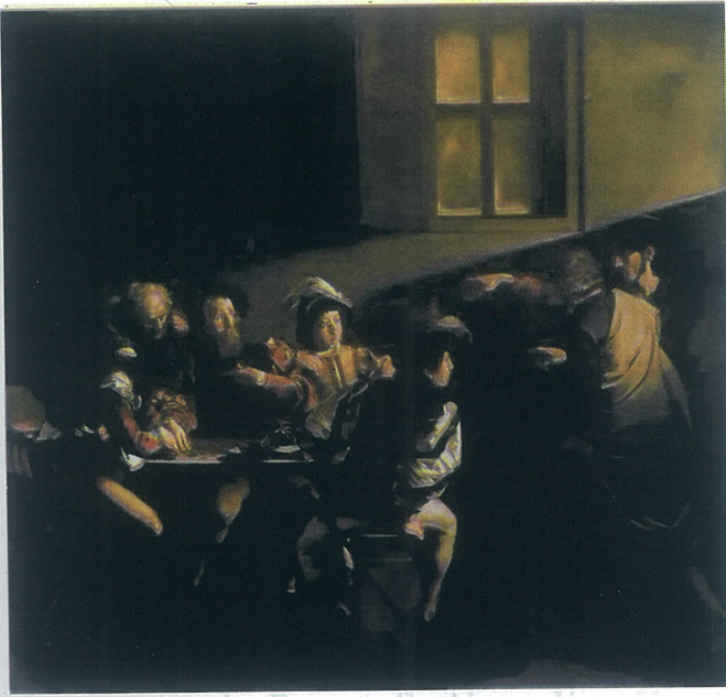
(1.2).The Calling of St. Matthew 1599-1600 .Tuval üzerine yağlıboya, 322 × 340 m.

Caravaggio'nun eserleri, bugün hala dünya çapında bir hayran kitlesine sahiptir ve Barok dönemi sanatının en önemli temsilcilerinden biri olarak kabul edilir. Dramatik ışık ve gölge kullanımı, gerçekçi figürler ve güçlü duygusal etkisiyle, Caravaggio'nun eserleri izleyiciler üzerinde derin bir etki bırakır.