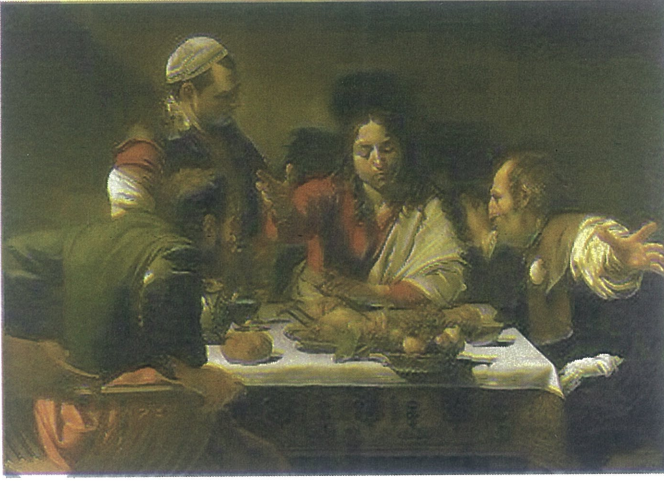
(1.3).Caravaggio Emmaus'ta Akşam Yemeği yak. 1601 . Tuval üzerine yağlı boya,141 cm × 196,2 cm (56 inç × 77,2 inç Ulusal Galeri LONDRA

Caravaggio'nun bu tablosu, dramatik aydınlatma tekniği, gerçekçi figürleri ve duygusal yoğunluğuyla dikkat çeker. Işık-gölge kontrastları, tablonun etkisini artırırken, figürlerin ifadeleri ve duruşları, olayın önemini vurgular. Bu tablo, Caravaggio'nun dini sahneleri canlılıkla ve duygusal derinlikle resmetme yeteneğini gösterir."The Calling of Saint Matthew," Caravaggio'nun döneminin en önemli sanat eserlerinden biri olarak kabul edilir ve onun dramatik tarzının bir simgesi olarak görülür.