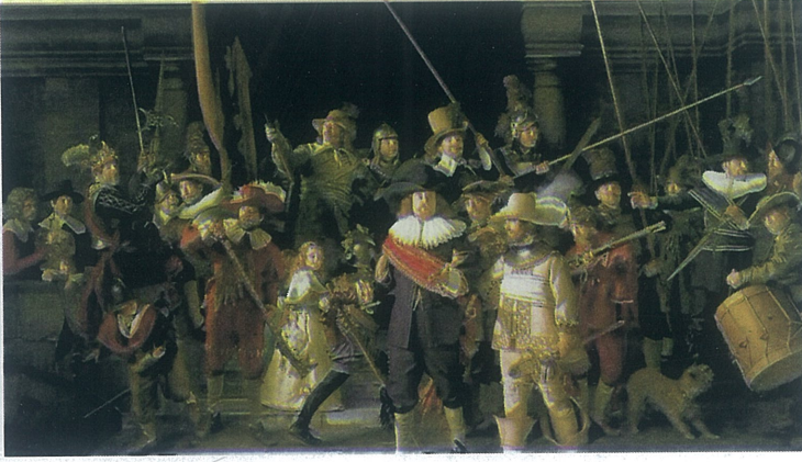
(1.6). Rembrandt Van Rijn , Gece Devriyesi 1642. Yađlı boya 363 cm× 437 cm. Rijksmuseum, Amsterdam

"Gece Devriyesi" (İngilizce: "The Night Watch"), Rembrandt van Rijn'in 1642'de tamamladığı ve bugün Amsterdam'daki Rijksmuseum'da sergilenen ünlü bir tablodur. Rembrandt'ın en tanınmış eserlerinden biri olan "Gece Devriyesi", 34 kişilik bir askeri birliğin canlandırıldığı büyük bir kompozisyonudur. Tablo, resmin ana figürlerinin komutan Frans Banning Cocq ve onun sağında yer alan ünlü kaleci Willem van Ruytenburch olduğu büyük bir sahneyi gösterir. Resimde, birlikleri harekete geçerken ya da bir görev için hazırlanırken tasvir edilmişlerdir. Arka planda ise birçok diğer asker ve sivil figür yer alır. "Gece Devriyesi"nin adı, resmin karanlık bir arka plan üzerinde canlandırılmasına rağmen, aslında bir gece sahnesini tasvir etmemesinden kaynaklanır. Tablo, 19. yüzyılda kir ve vernik katmanlarının temizlenmesi sırasında yanlışlıkla kararmıştır ve bu nedenle eskisi kadar parlak görünmez. Bununla birlikte, resmin atmosferi ve figürlerin dinamik hareketleri hala etkileyicidir. "Gece Devriyesi", Rembrandt'ın ustalığını ve ışık-gölge oyunlarını ustalıkla kullanma yeteneğini sergileyen önemli bir eserdir. Ayrıca, resmin detayları ve figürlerin canlılığı, Rembrandt'ın dönemindeki askeri ve sosyal atmosferi de yansıtır.