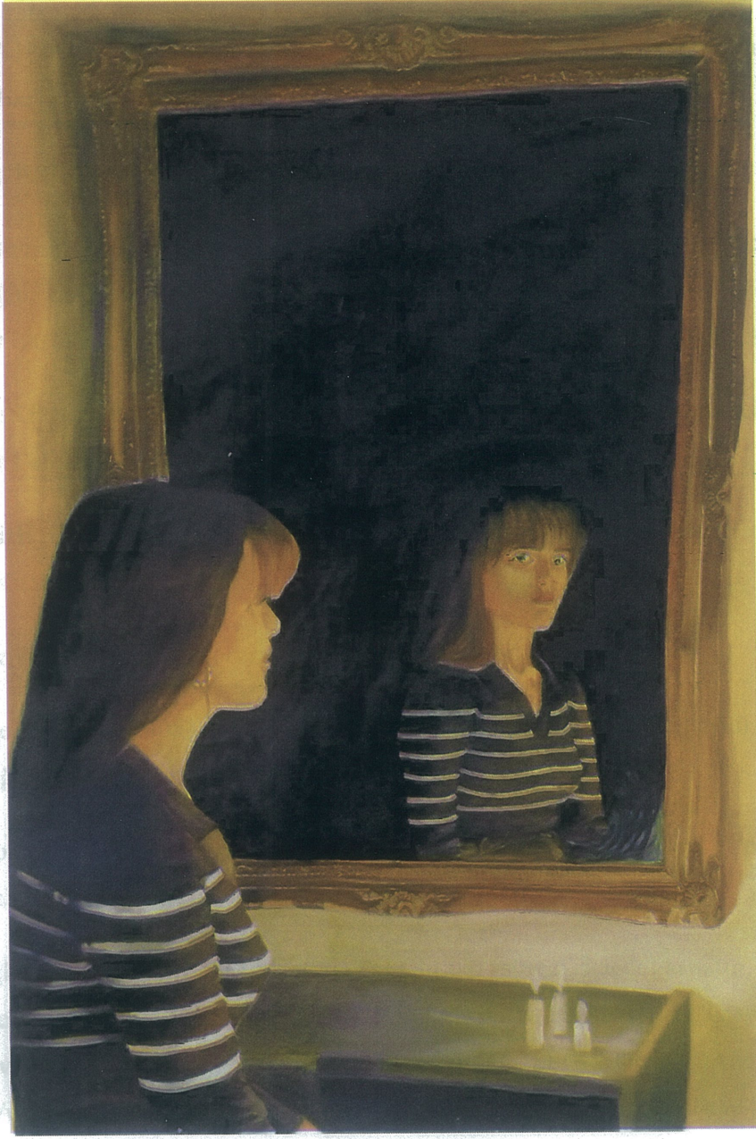
Resim 9: Düz teknik, Yağlı Boya,100x70