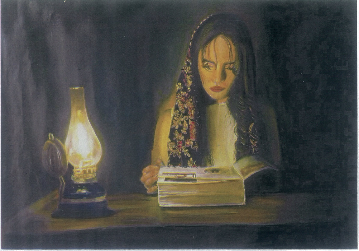
Resim 8: Düz teknik, Yağlı Boya,100x70