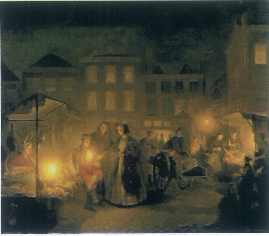
(1.7) Petrus van Shendel, Market by Candlelight, Lahey'deki Pazarlar 1869 Tuval üzerine yağlıboya 2048x 1767