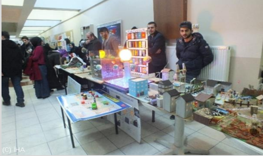
Fotoğraf 10. Öğretim Teknolojileri ve Materyal Tasarımı Dersi Sergisi